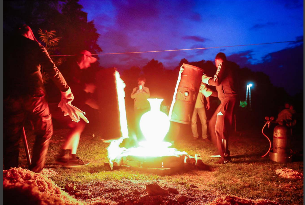
Éjszaka megvalósított égetés