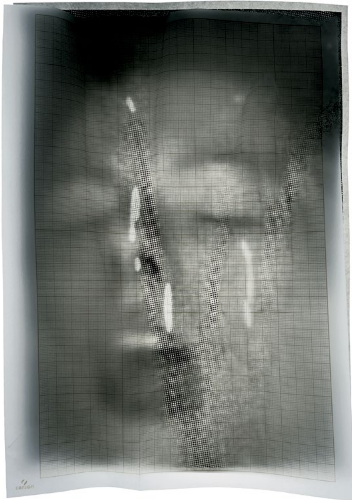
Csontó Lajos: Egybeesés · Coexistence, 2022

A középformátumú monokróm printek alkotják a kiállítás fő ívét, az egymásra vetülő, többretegű képek alapját egy-egy fotó képezi, melynek második rétege, lehet egy rajz, egy tárgy vagy egy szimbolikus jelentésű anyagfelület is. A fotogramszerű nyomatok az individuális misztikus, intuitív, tudatalatti részét hivatottak megszólítani. Bár az eredeti képek és a rájuk rakódó transzparens rétegek „egybeesése” véletlenszerű találkozásnak tűnik, létrejöttüket, mégis megelőzi egy sor alkotói fázis: