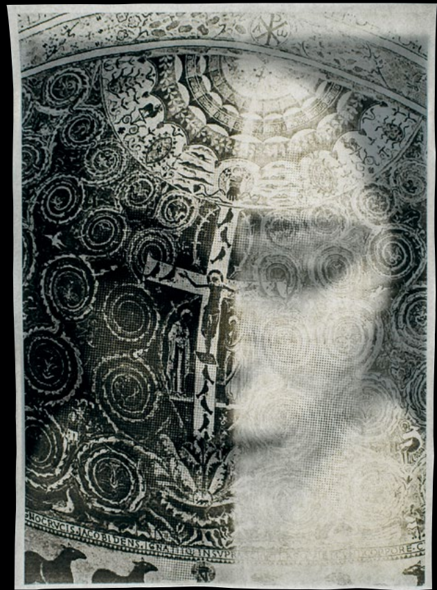
Csontó Lajos: Egybeesés · Coexistence, 2022