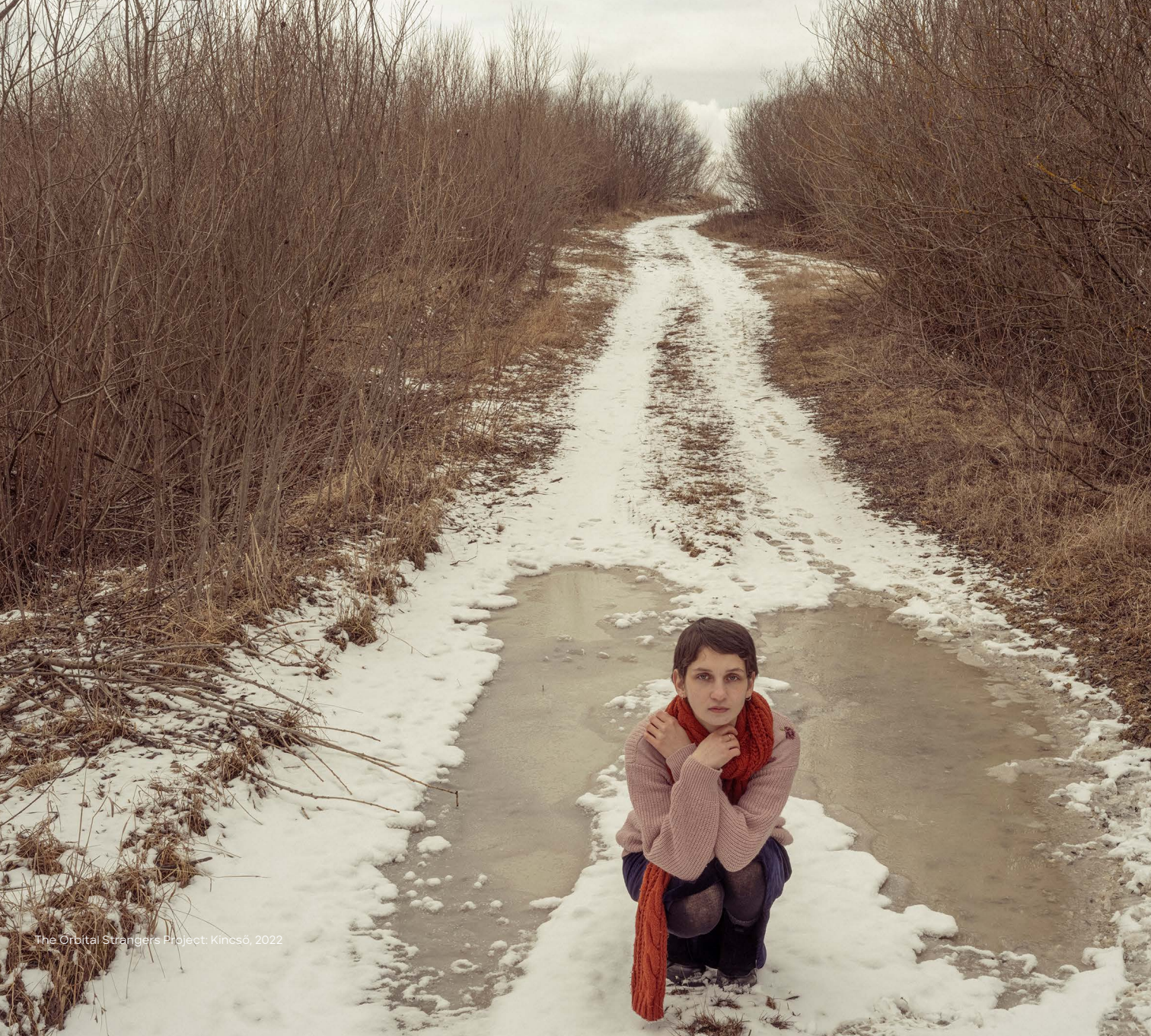
The Orbital Strangers Project: Kincsó, 2022