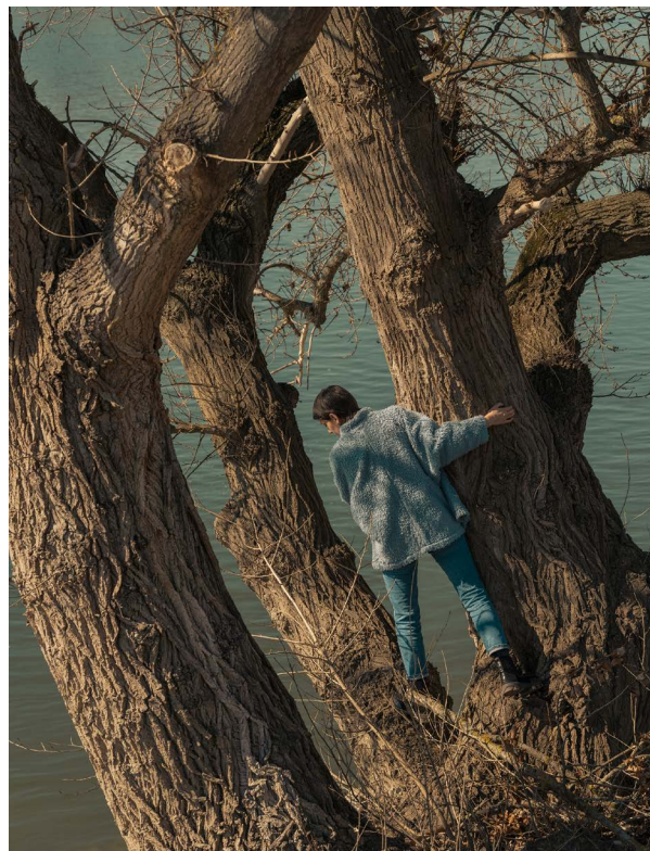
The Orbital Strangers Project: Kincső, 2022

This is the story of a journey, with only the start and the destination depicted. In spirit, Kincső is in Gheorgheni (Gyergyószentmiklós) and Budapest at the same time. Although the images are limited to these two locations, there are a host of historical, cultural, social and infrastructural factors between the two positions that have shaped her journey to her new home, the discovery of which is also a discovery of herself. When she decided to change home, she knew very well she could only truly know and understand