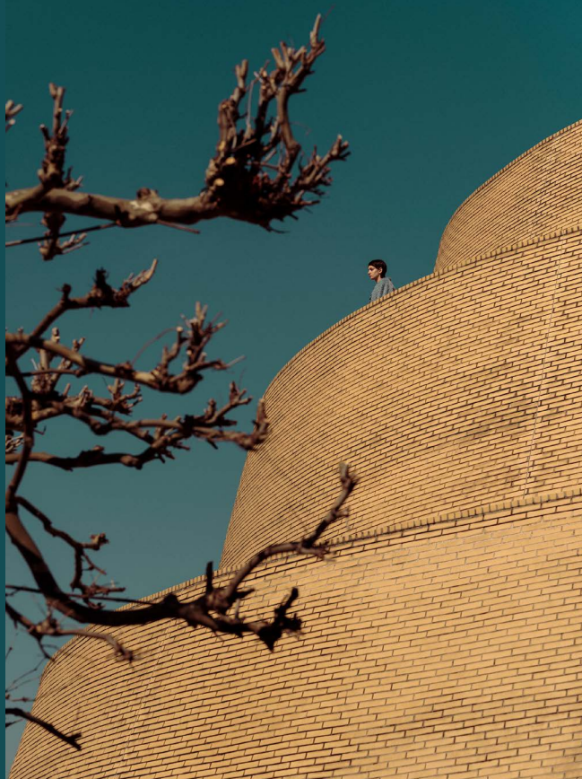
The Orbital Strangers Project: Kincsó, 2022