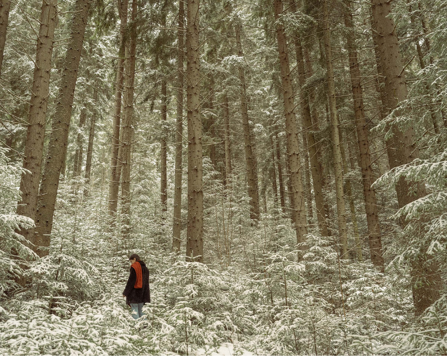
The Orbital Strangers Project: Kincső (részlet | detail), 2022