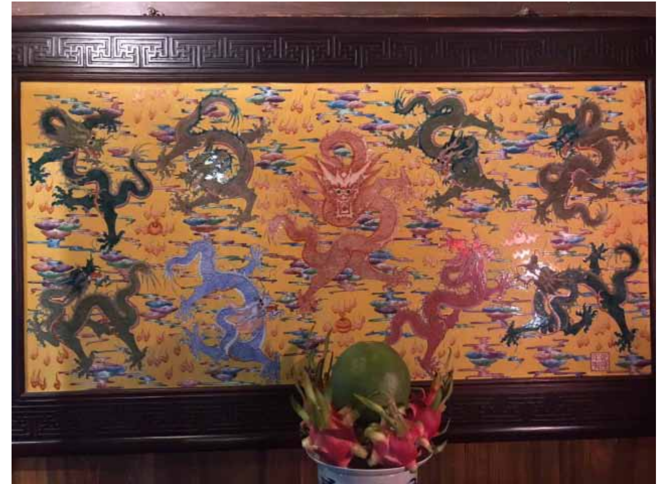
Sárkányokat ábrázoló berakásos oltár. Ninh Binh Vietnam.

A folyók- vizek témához egy másik vonalon kapcsolódik, a különböző természeti erőket jelképező sárkányok képe. Ezeket a képeket is szeretném tovább dolgozni.