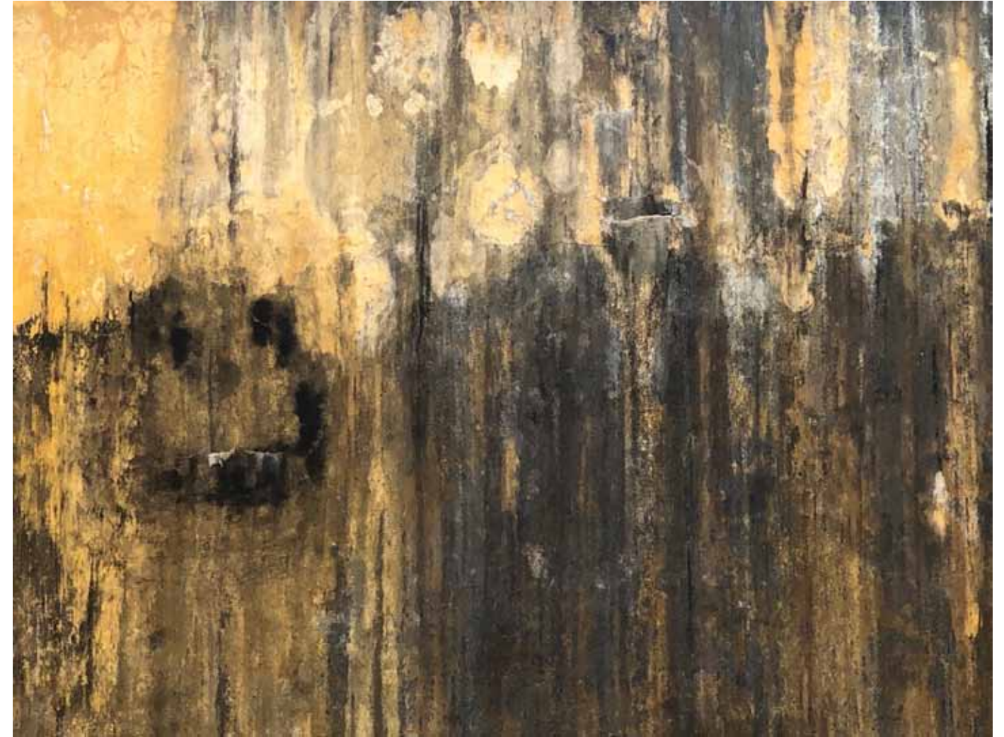
Fal felületek gyűjtés, további munkákhoz..