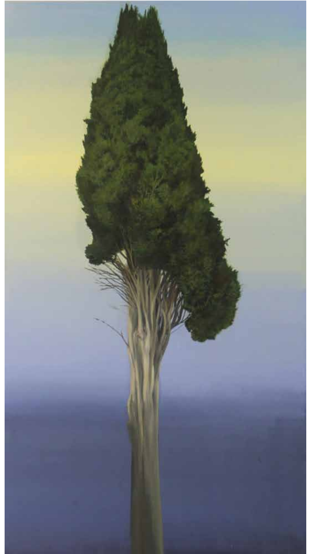
Ciprus 200x110cm, olaj, vászon, 2022.

Az Égig érők c sorozatot 13 db képre tervezem. Jegenyék, cyprusok, piramis tölgy... Együtt alkotnának egy kiállítá- sra kész anyagot.