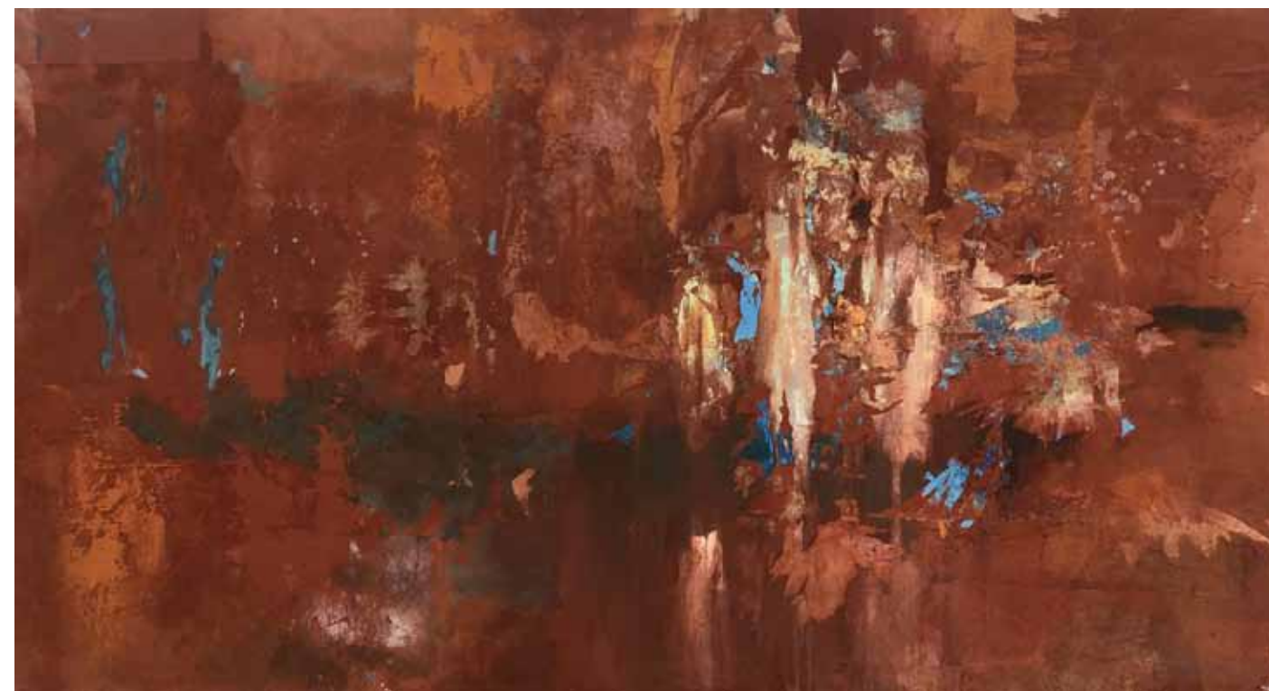
Hue Falak 110x200cm vegyes technika,vászon, 2022.