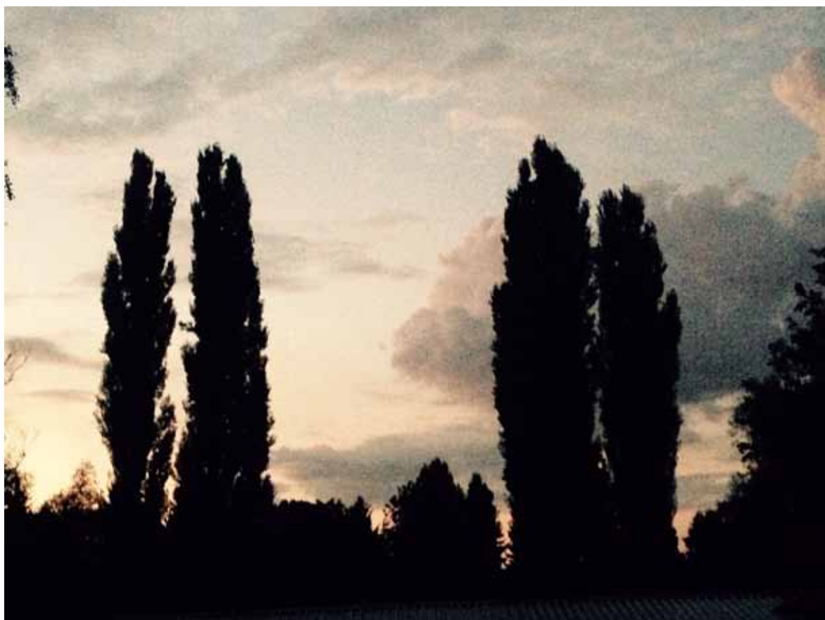
Fotó vázlatok az Égig-érők c. sorozathoz.