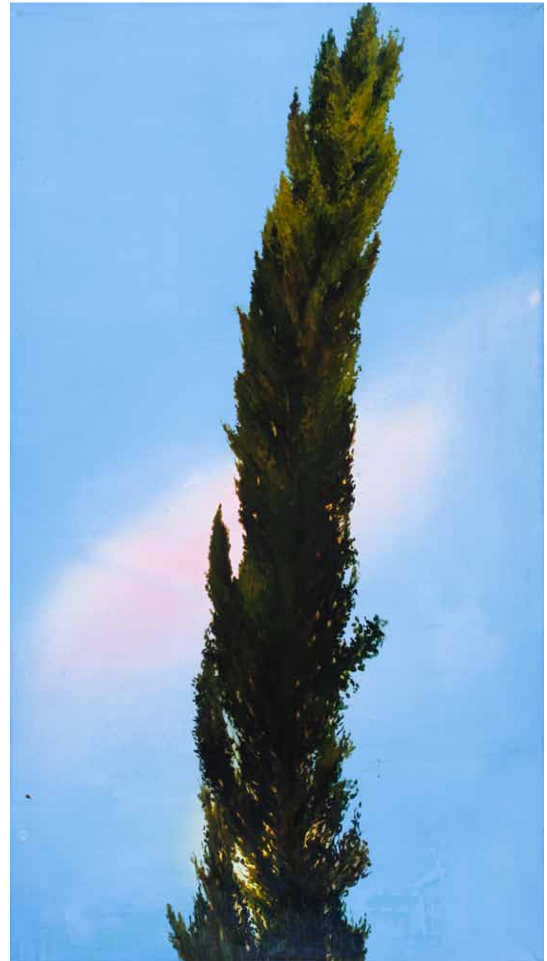
Jegenye III. 200x110cm olaj,vászon 2021.