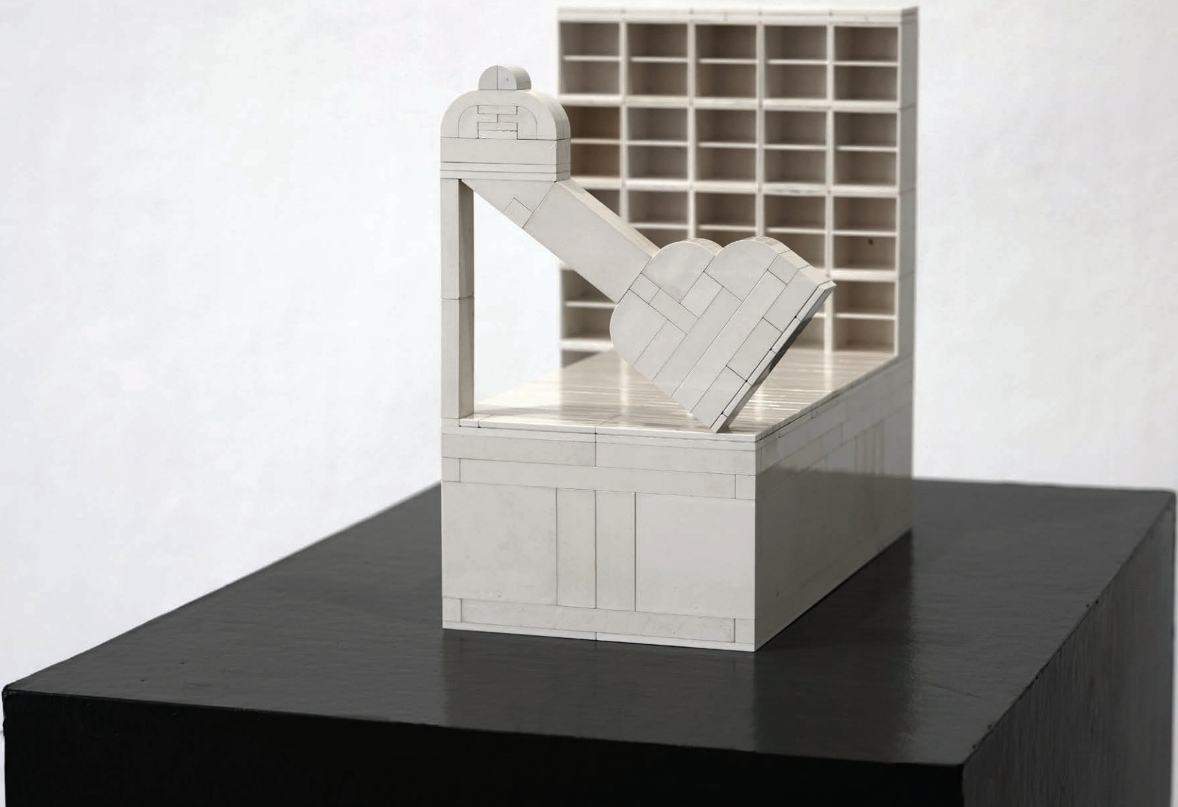
GYM 2023 ABS műanyag 30x16x30 cm