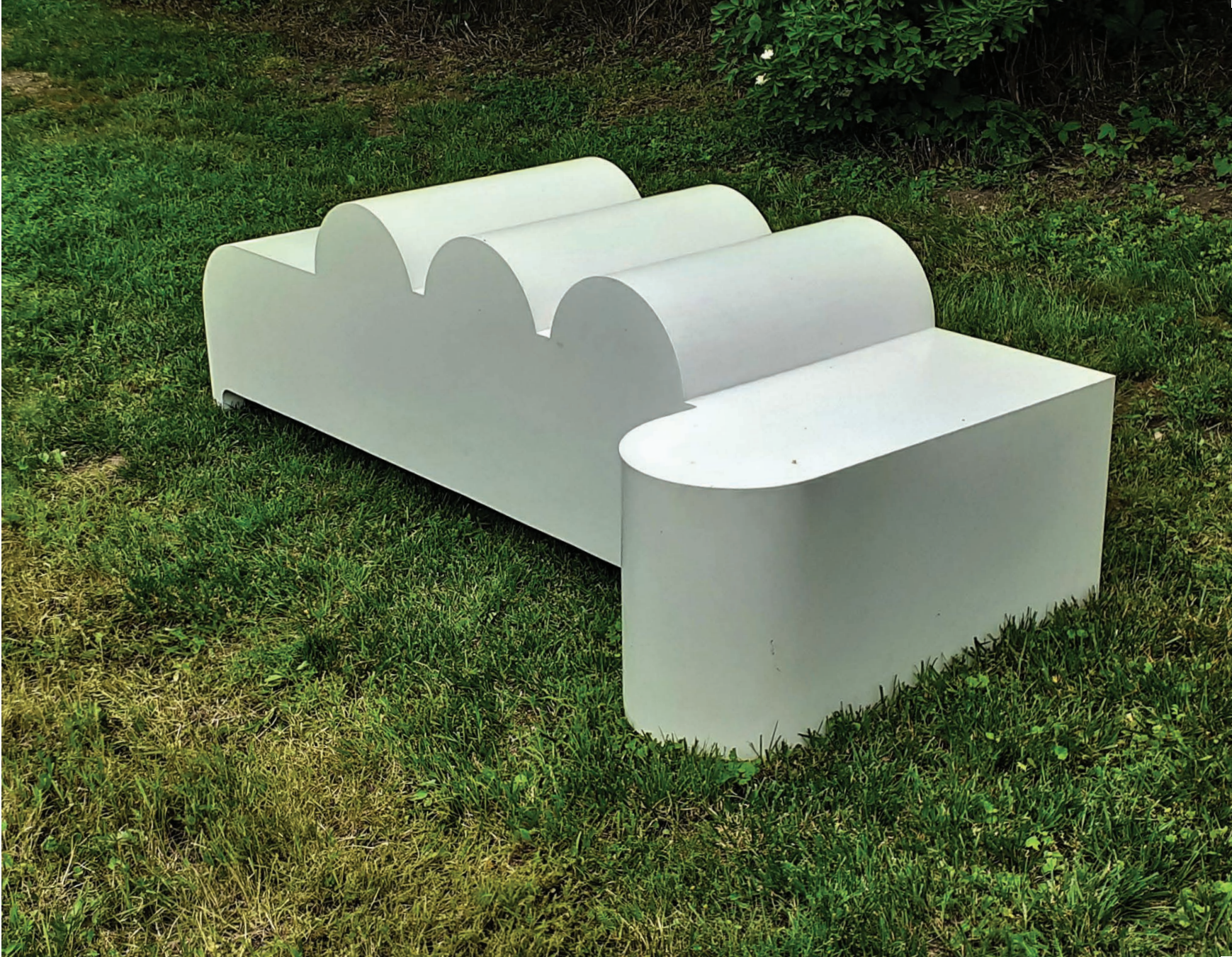
KÉTNAPOS CSIBE 2011 festett acéllemez, 80X220X120 cm