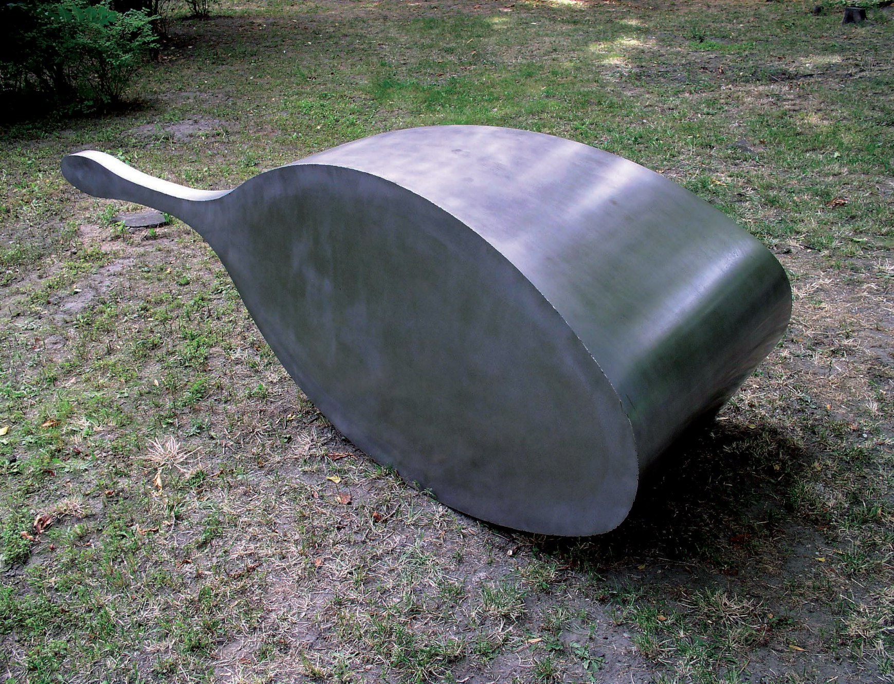
PINORITO 2005 acél, 100x190x80 cm