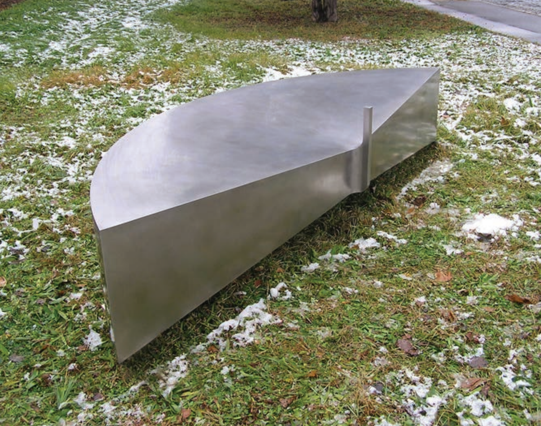
LOTUS 2006 acél, 320x130x80 cm