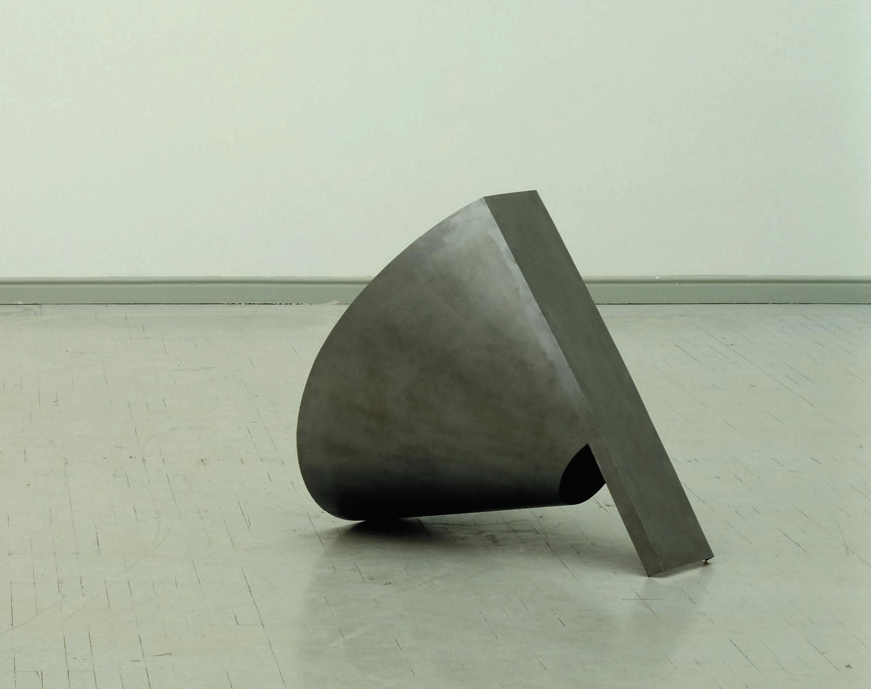
TORKITA 2004 acél, 140x120x120 cm