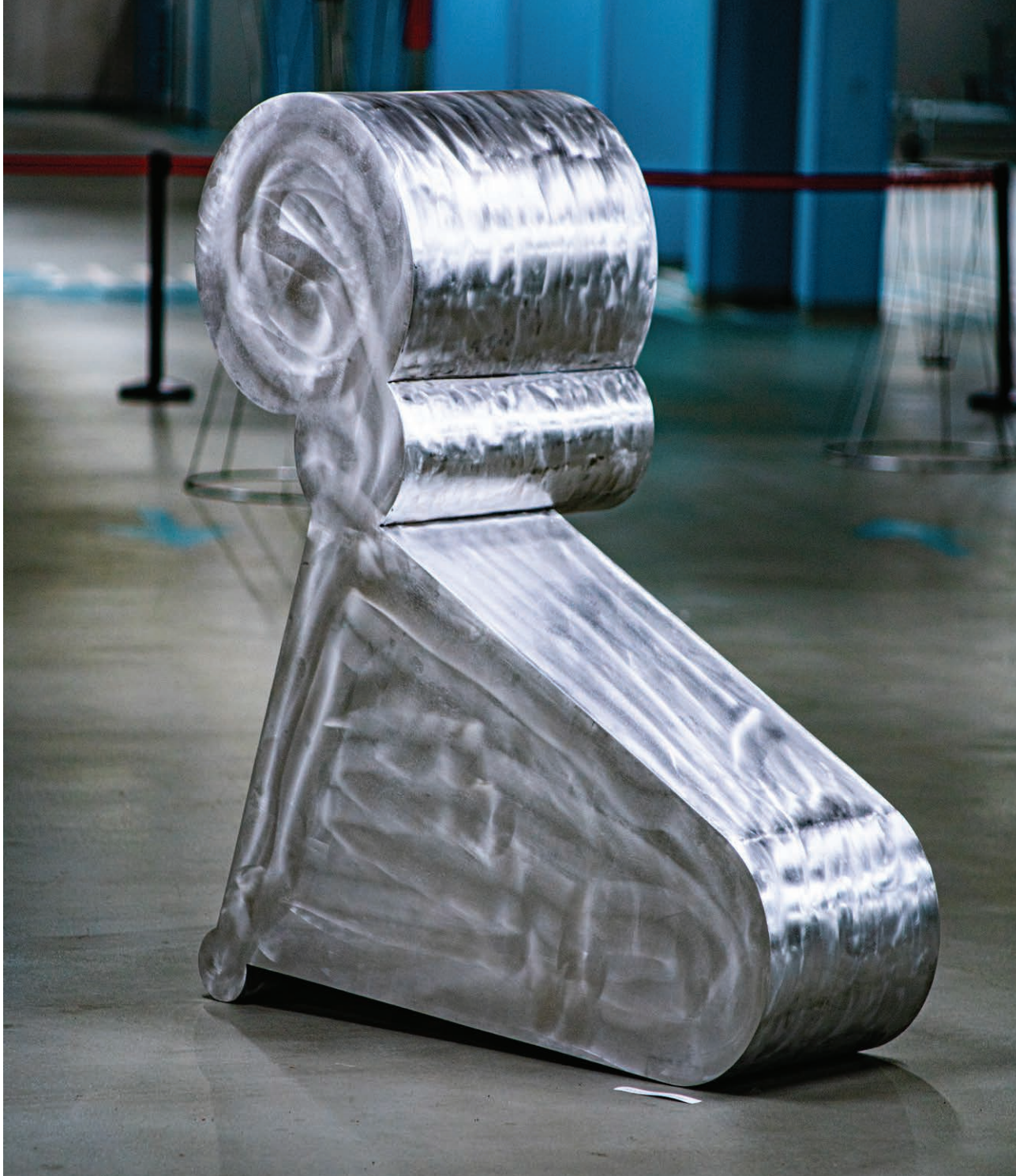
SZOKÁSOS KÖREIM 2022 alumínium lemez 150x120x120