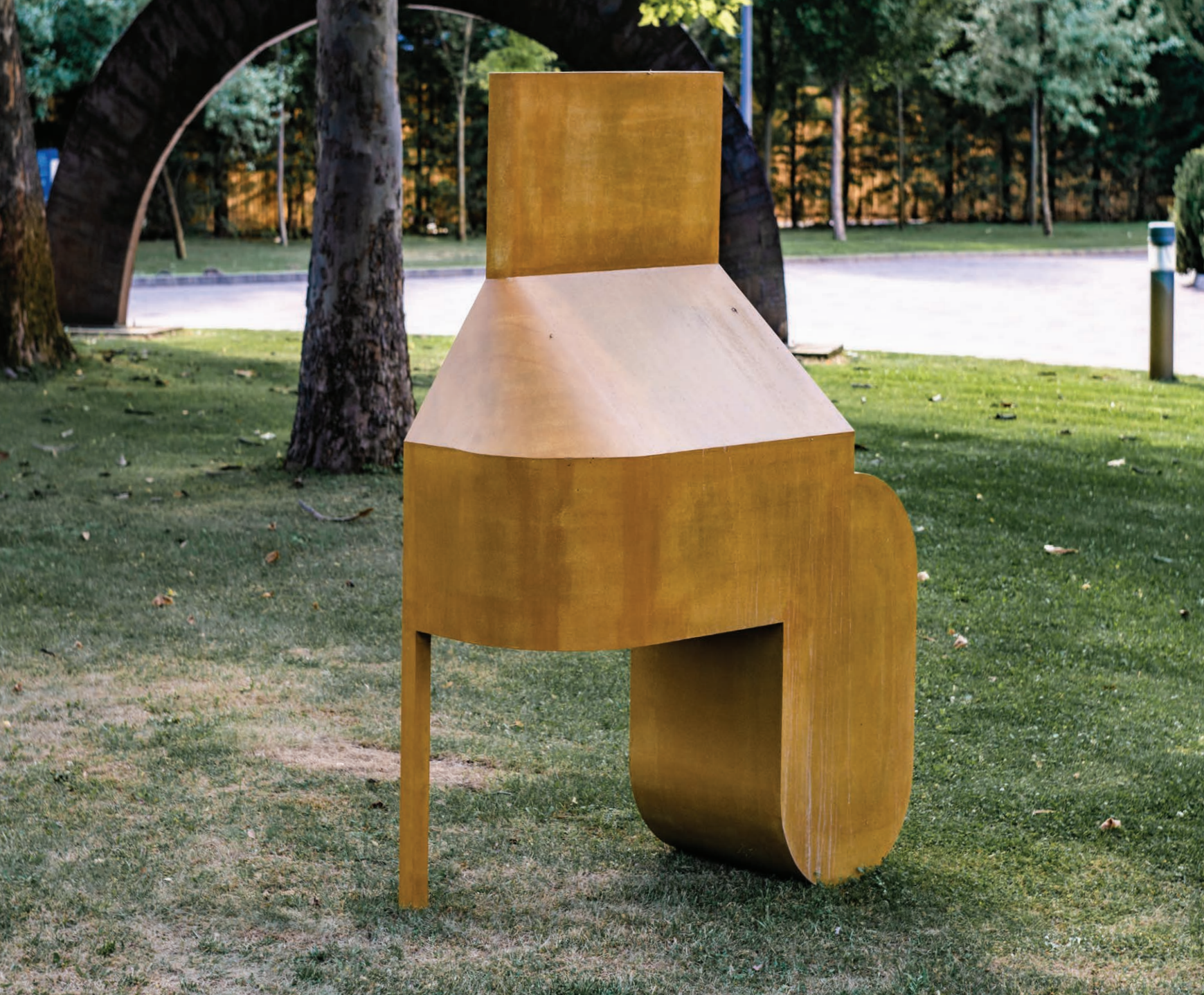
IZMI 2022 festett alumíniumlemez, 190x120x70 cm