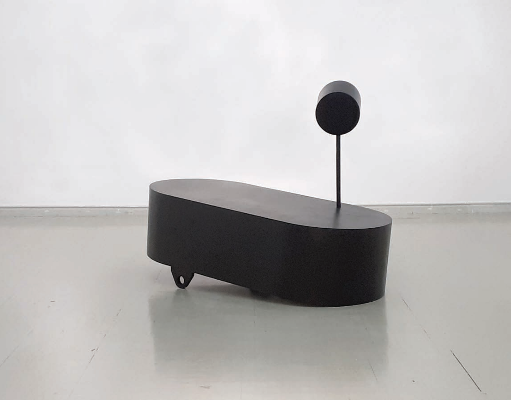
FOTÓZKODÓ 2019 acéllemez, 140x200x90 cm