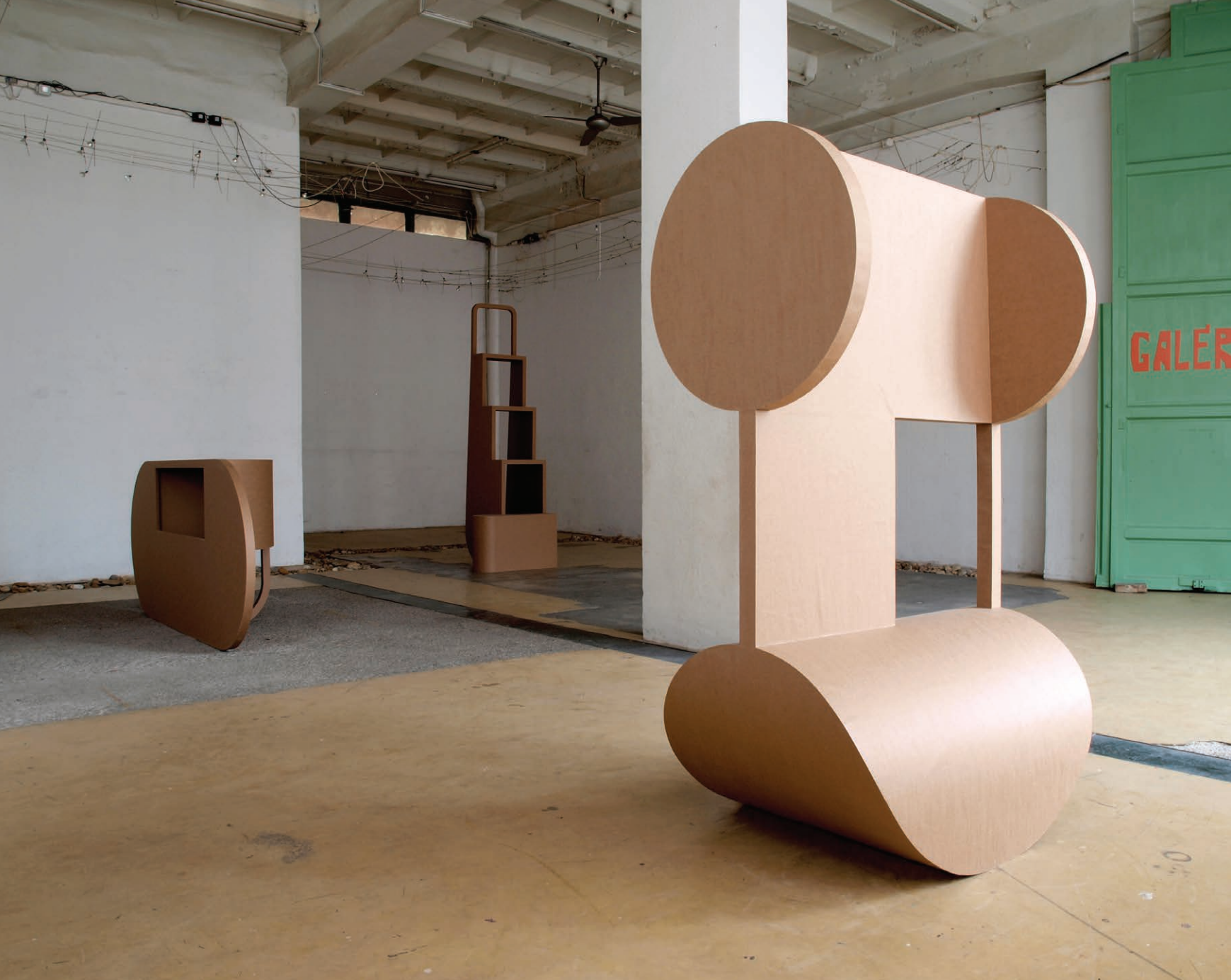
BILL 2009 karton 220x200x150 cm