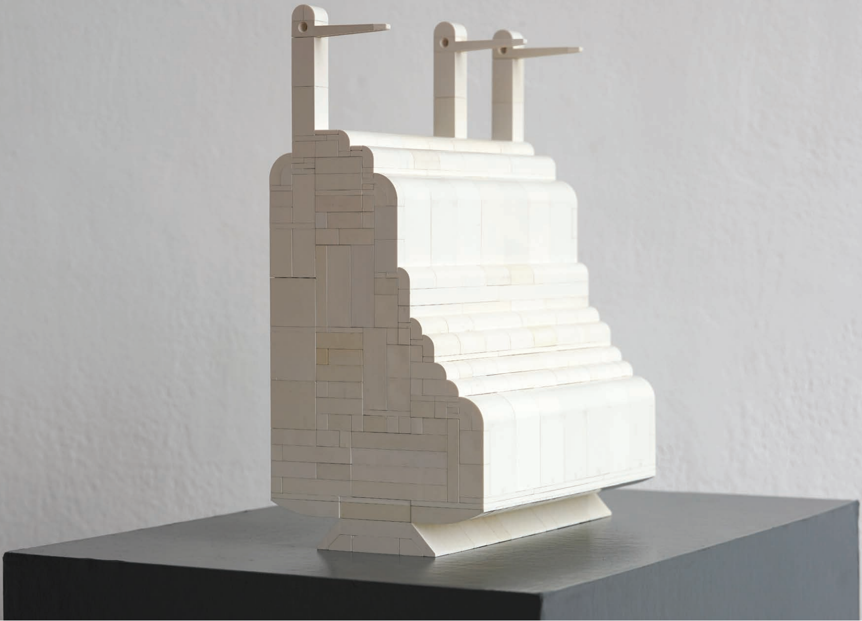
SORSZEM 2023 ABS műanyag 40x25x15 cm