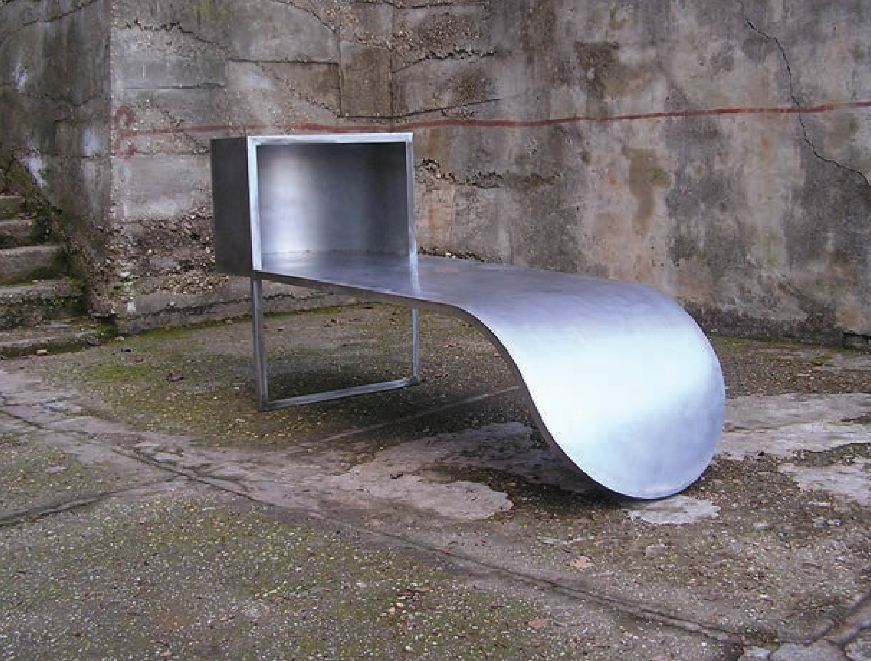
EMBÓKABIN 2006 rozsdamentes acél, 160x240X90 cm