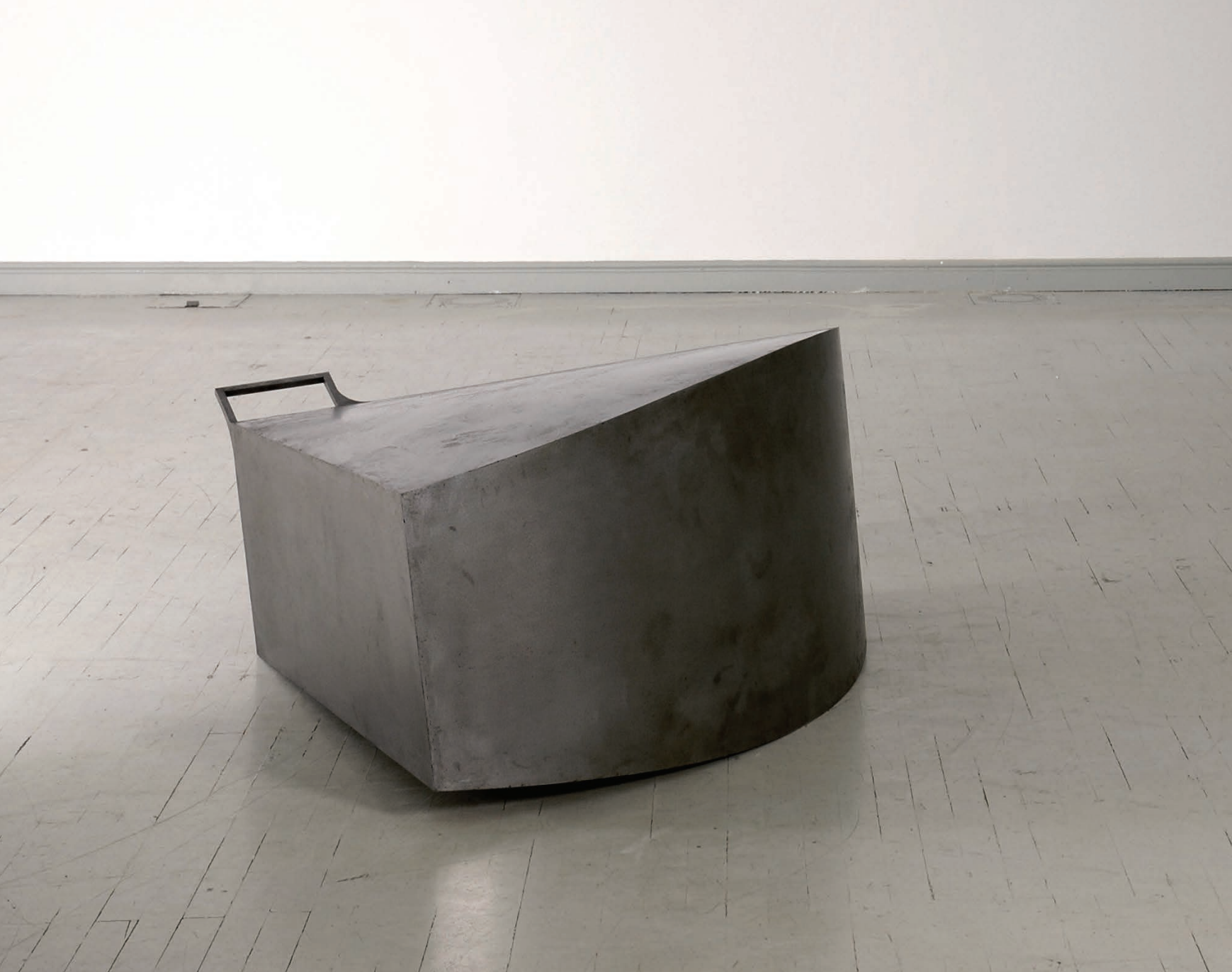
FÜLES 2004 acél, 120x140x140 cm