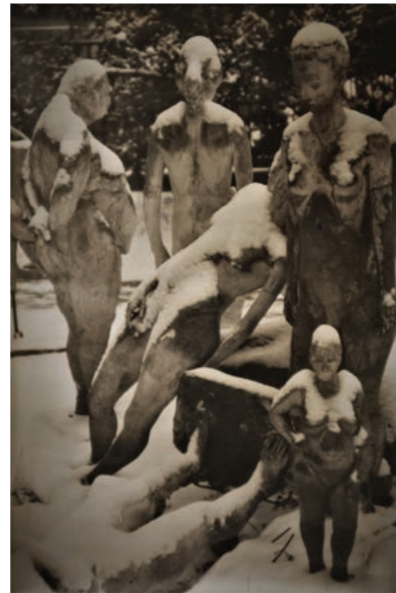
Alma mater 100 x 153 cm, kísérleti fotográfia