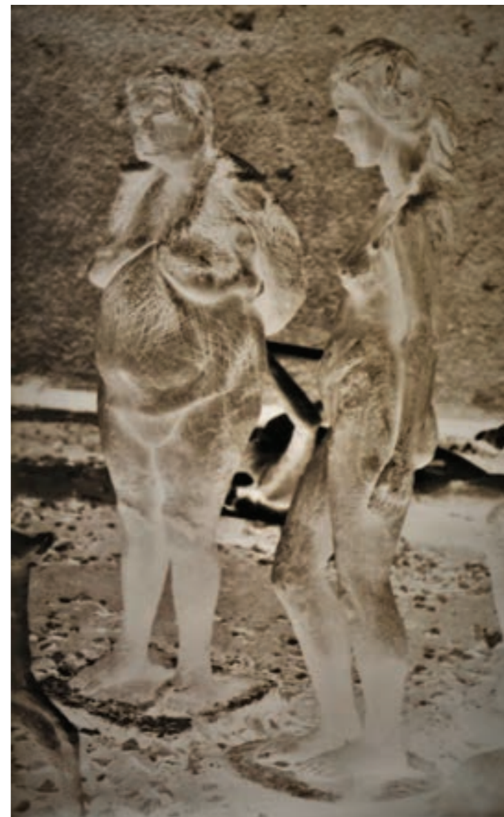
Egymásra utalva 100 x 153 cm, kísérleti fotográfia