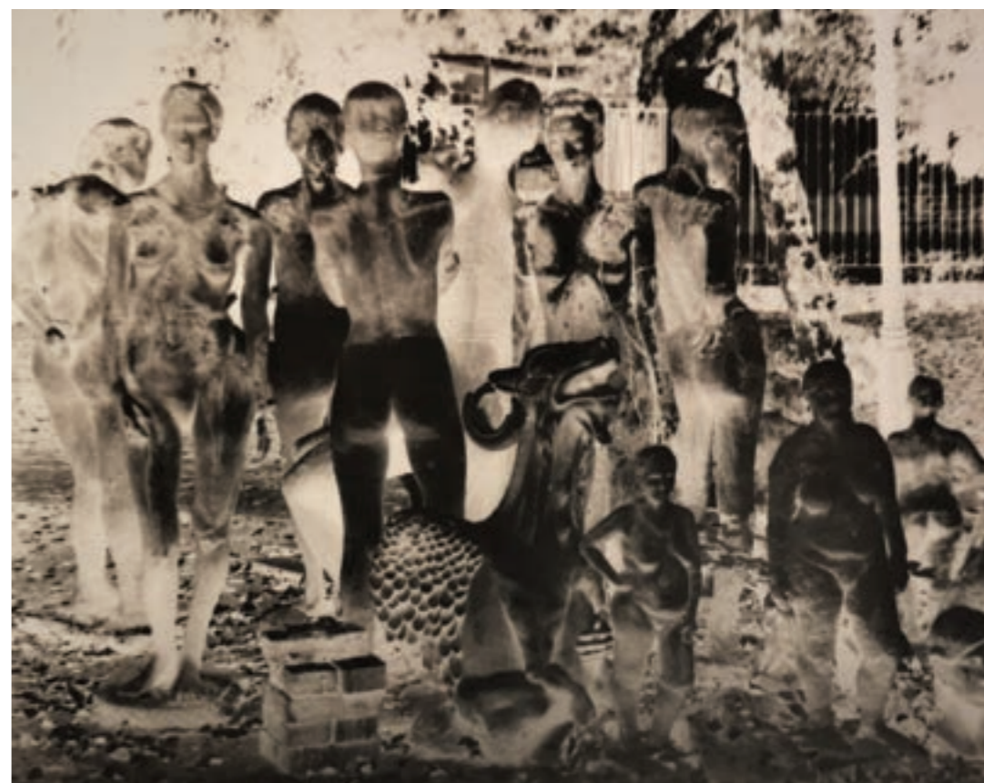
Idill 78 x 58 cm, kísérleti fotográfia