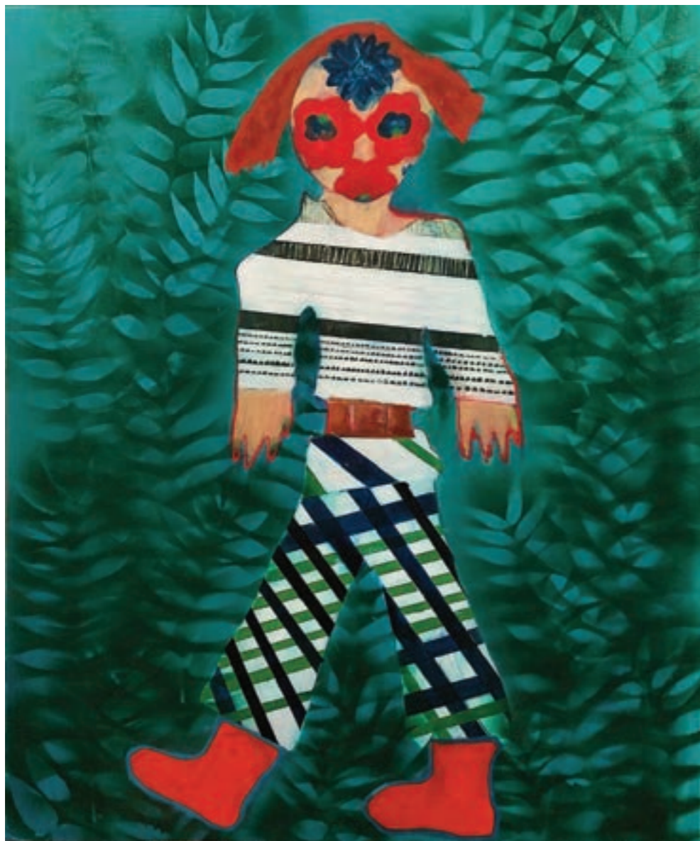
Virágharcos 100 x 120 cm, vegyes technika