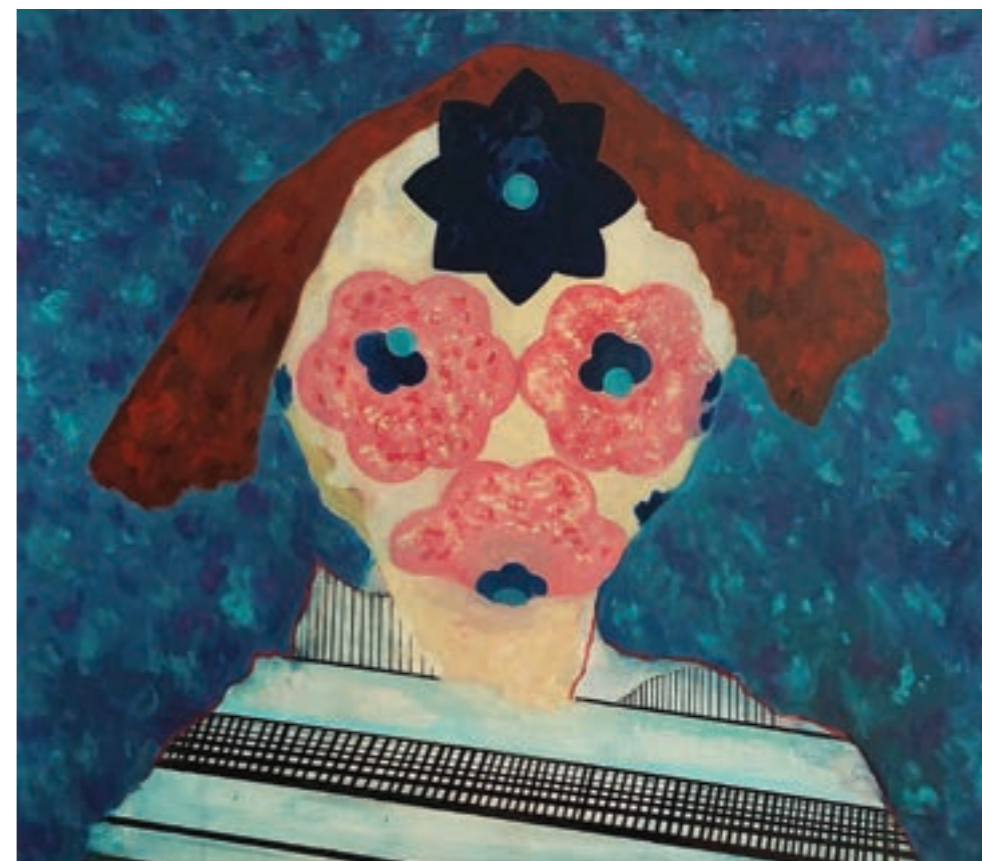
Mágus 110 x 90 cm, vegyes technika