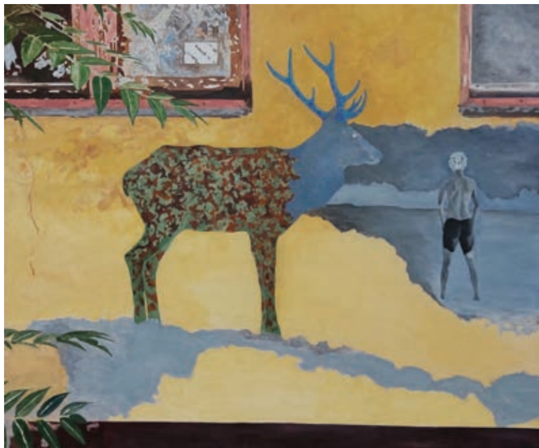
Személyes tér 150 x 125 cm, olaj, vászon