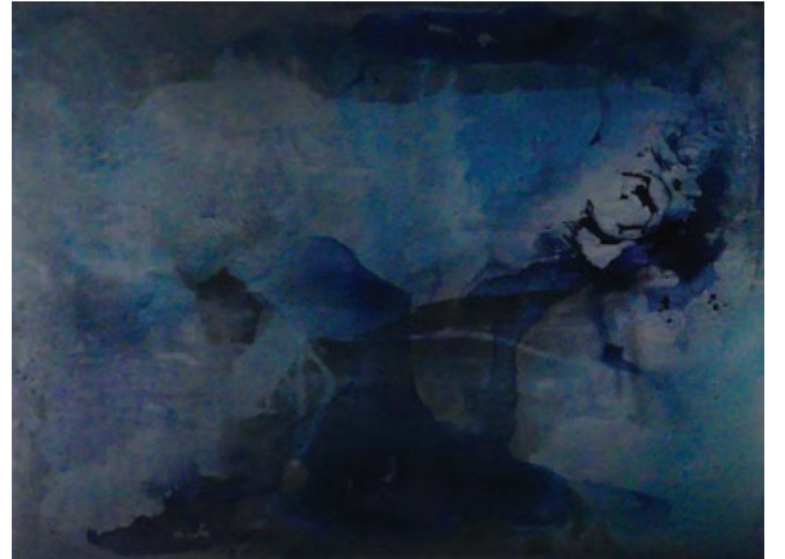
Dream 133 x 100 cm, vegyes technika