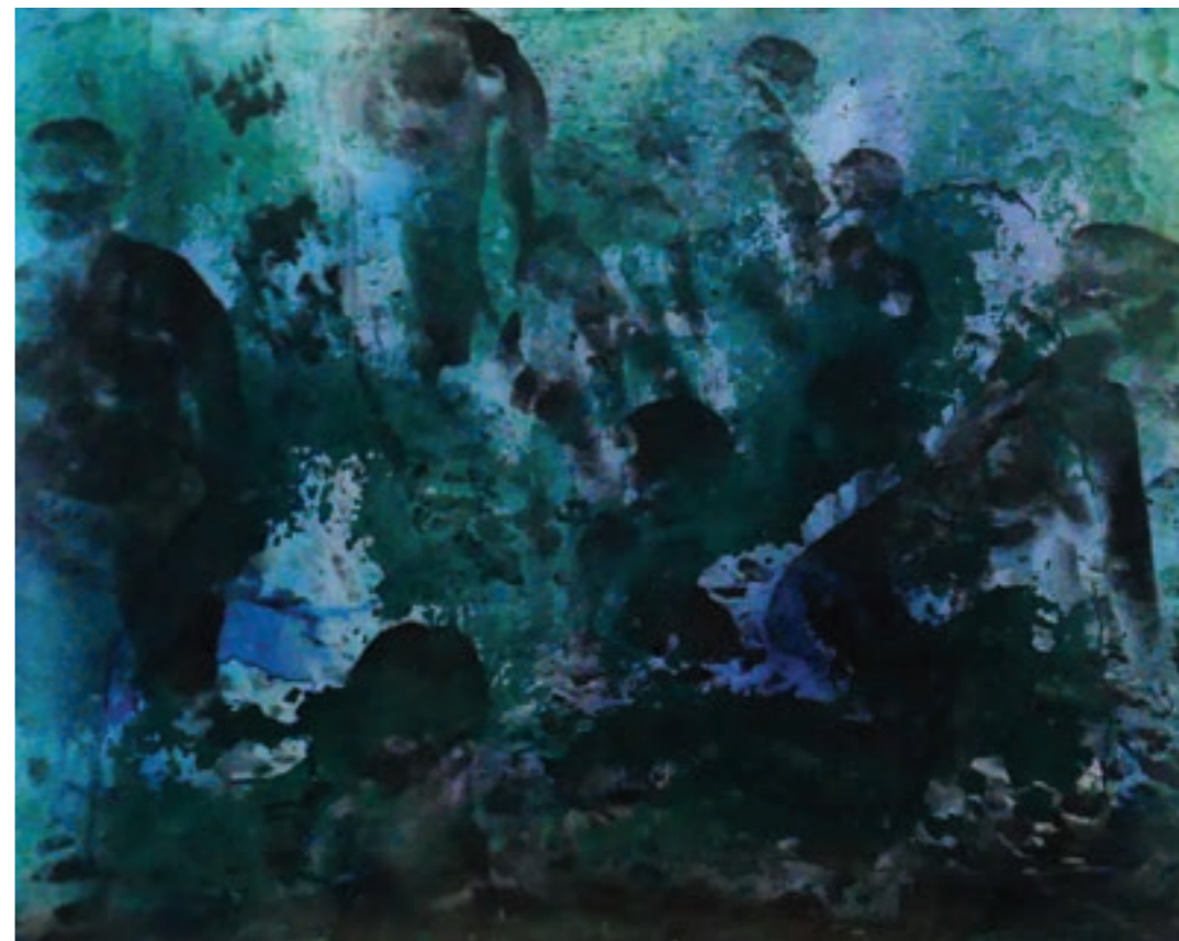
Nüx gyermekei 60 x 50 cm, vegyes technika