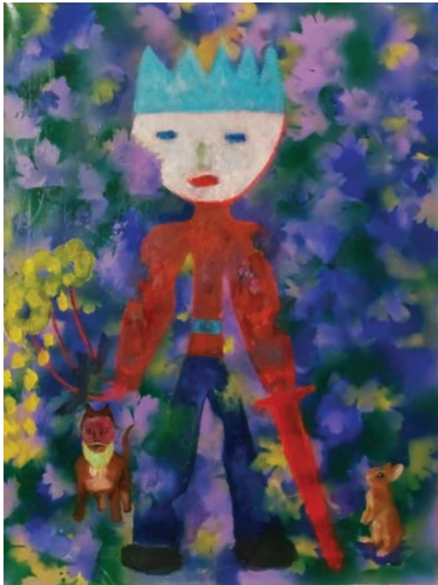
Rozsdalovag 58 x 78 cm, vegyes technika