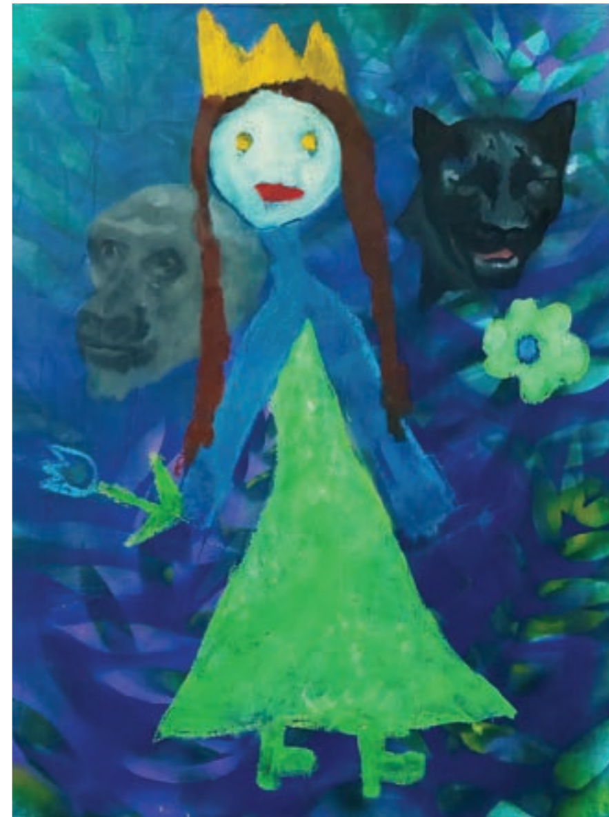
Védelmesők 50 x 60 cm, vegyes technika