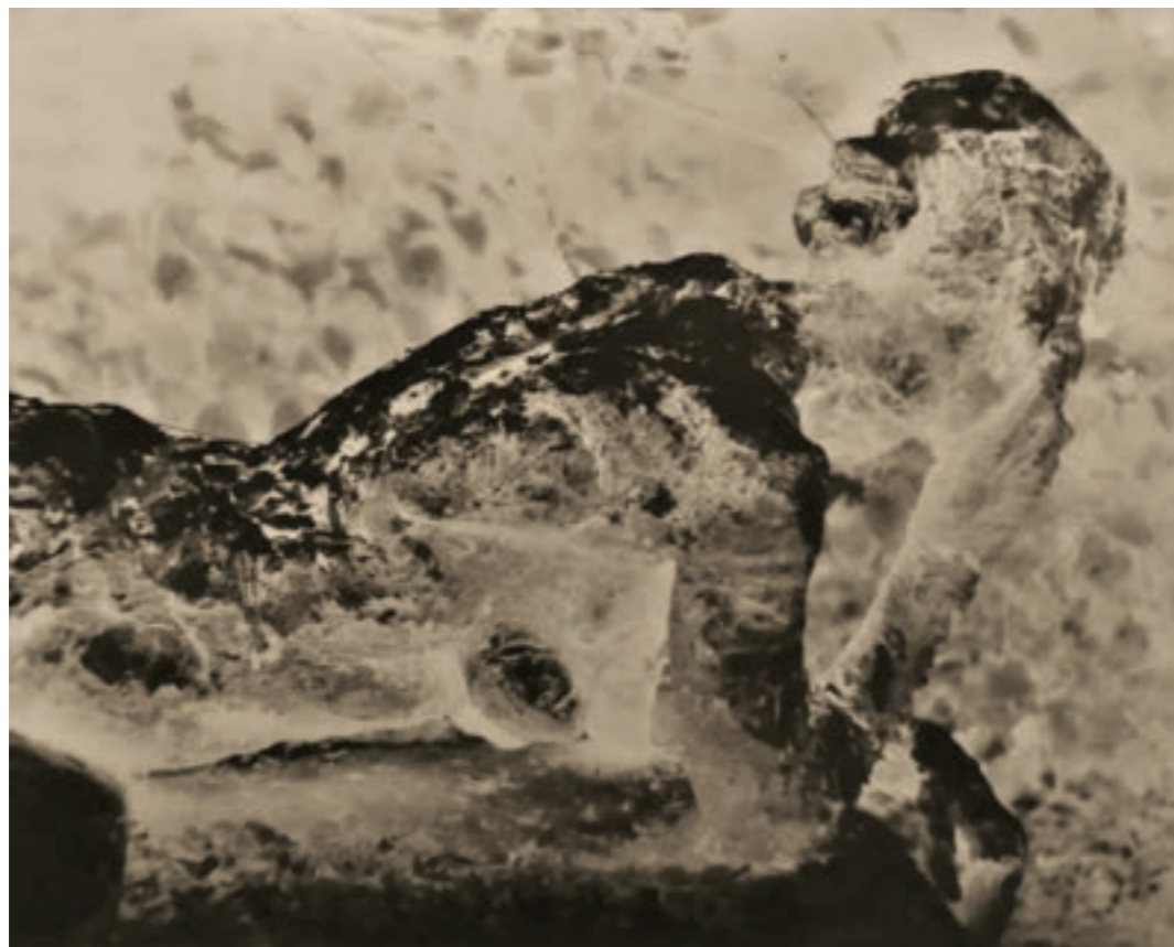
Gondolkodó 78 x 58 cm, kísérleti fotográfia