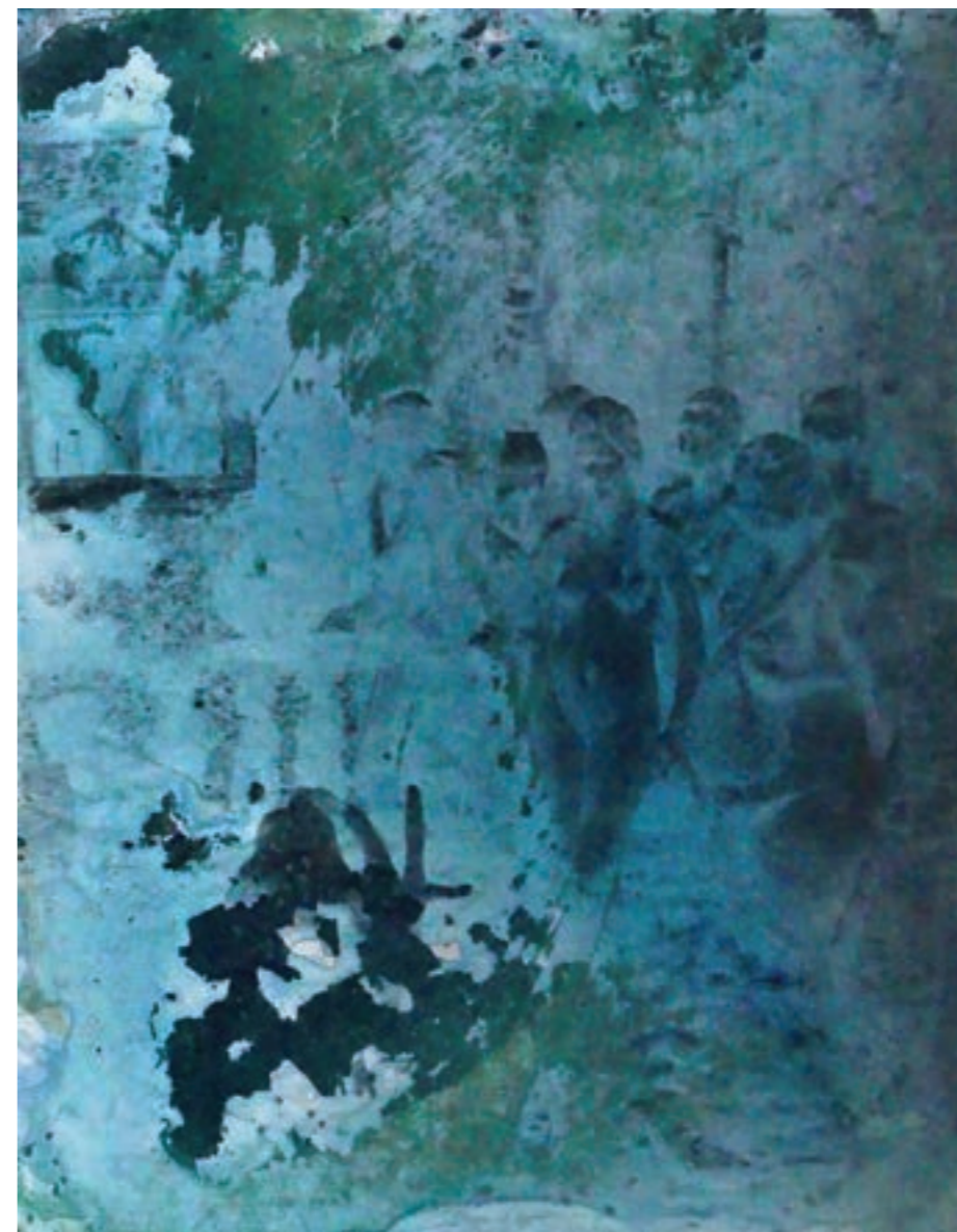
Trip 50 x 60 cm, vegyes technika