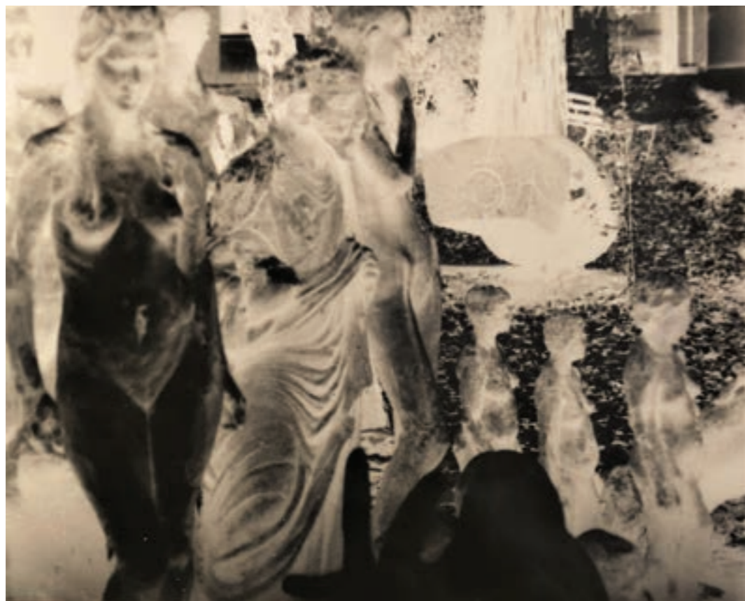
Színfalak mögött 78 x 58 cm, kísérleti fotográfia