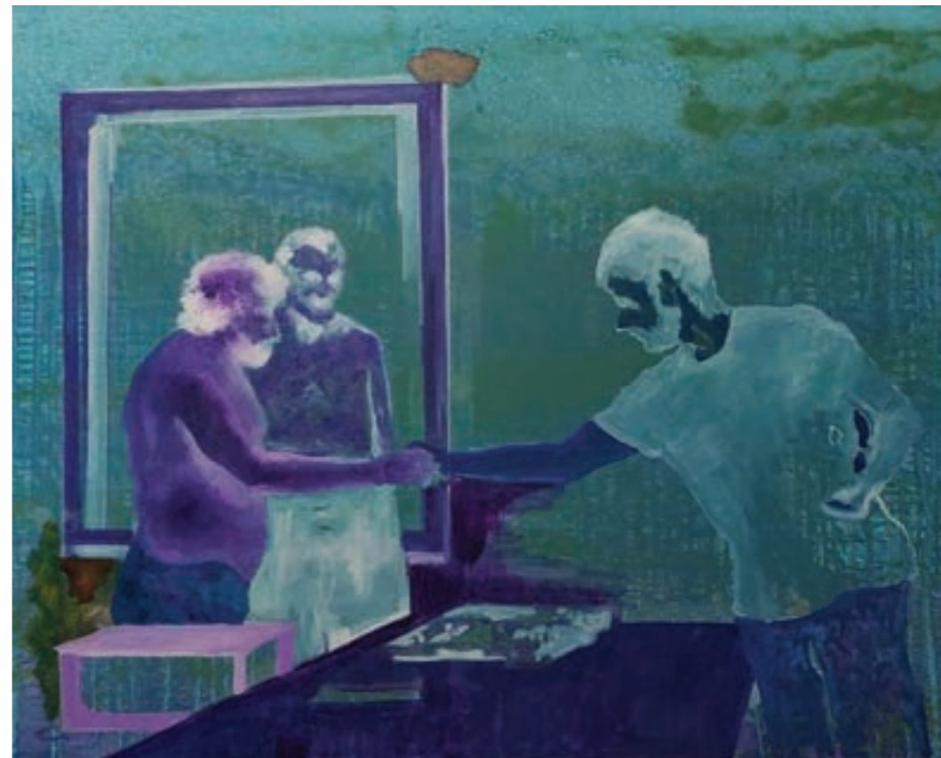
A megtalált elem 100 x 80 cm, olaj, vászon