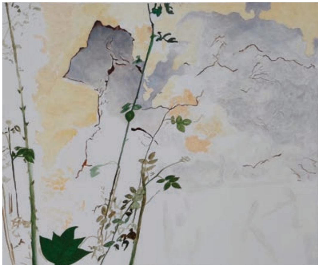
Harmónia 150 x 125 cm, olaj, vászon