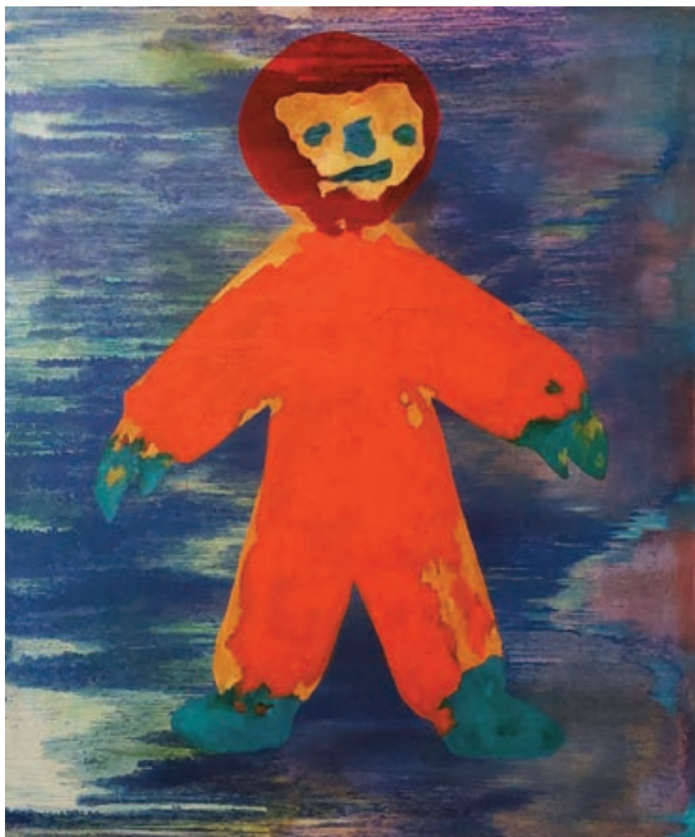
Léglovag 125 x 150 cm, vegyes technika