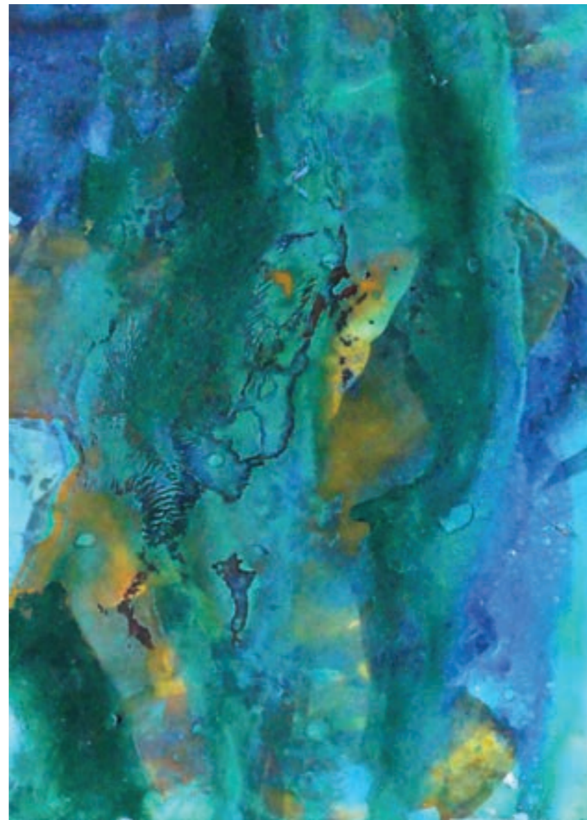
Fosszília 30 x 40 cm, vegyes technika