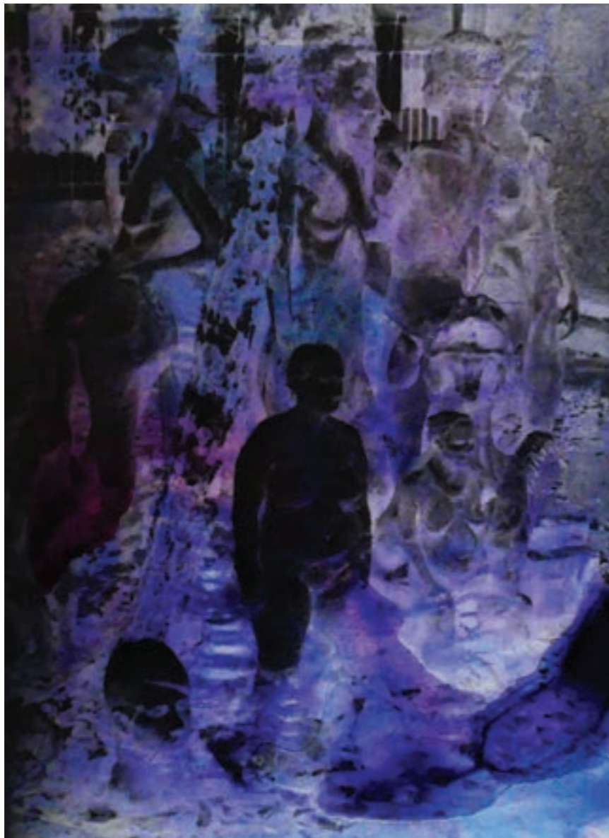
Zóna 100 x 125 cm, vegyes technika