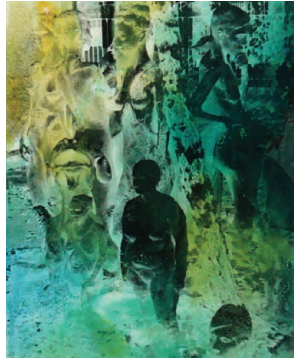
Solar 50 x 60 cm, vegyes technika