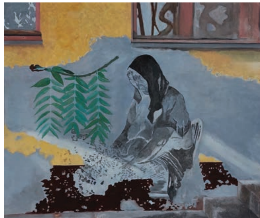
Rekonstruált üzenet 150 x 125 cm, olaj, vászon