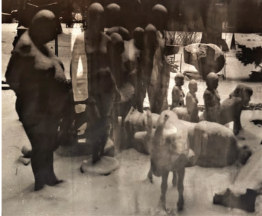
Függöny 60 x 50 cm, kísérleti fotográfia