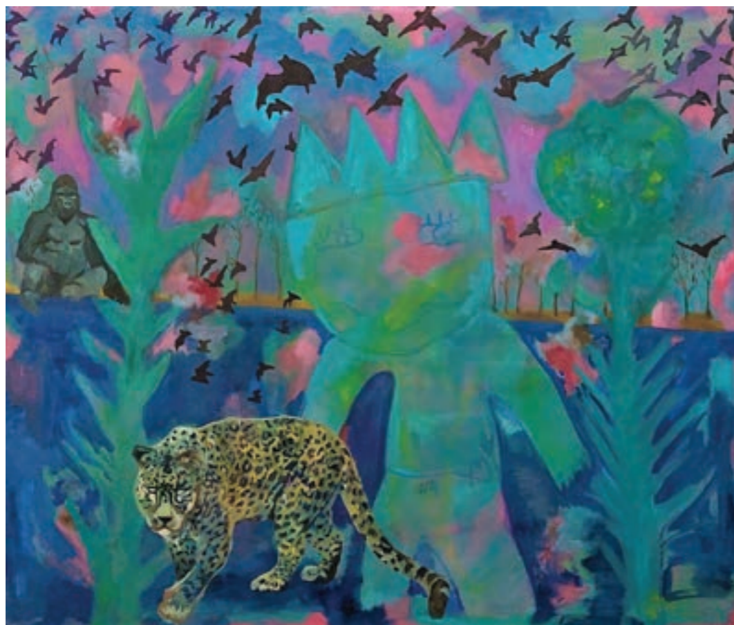
Emlékek párbaja 150 x 125 cm, vegyes technika