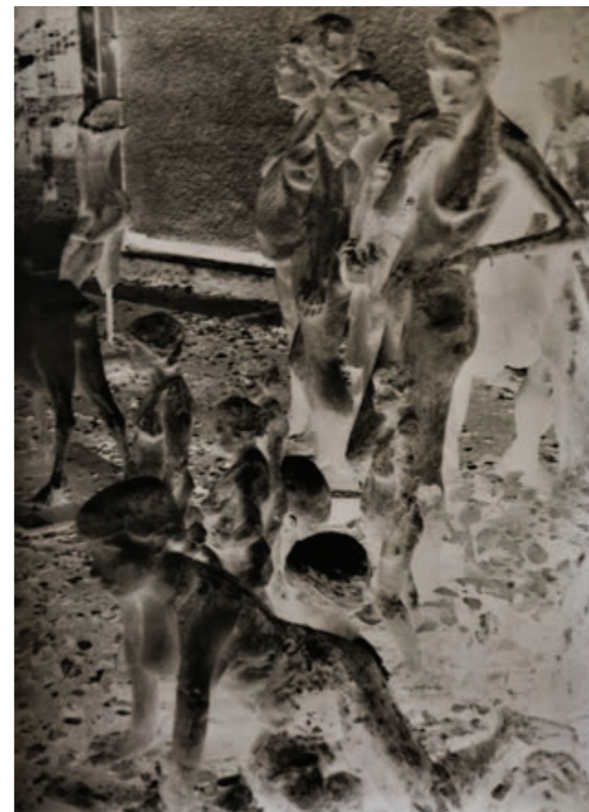
Expozíció 100 x 153 cm, kísérleti fotográfia