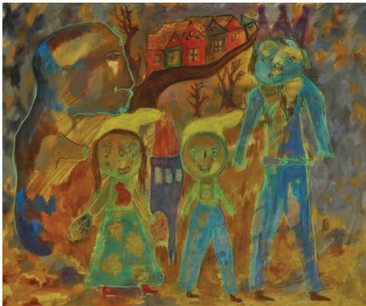
Királyok és kalandorok 145 x 120 cm, vegyes technika