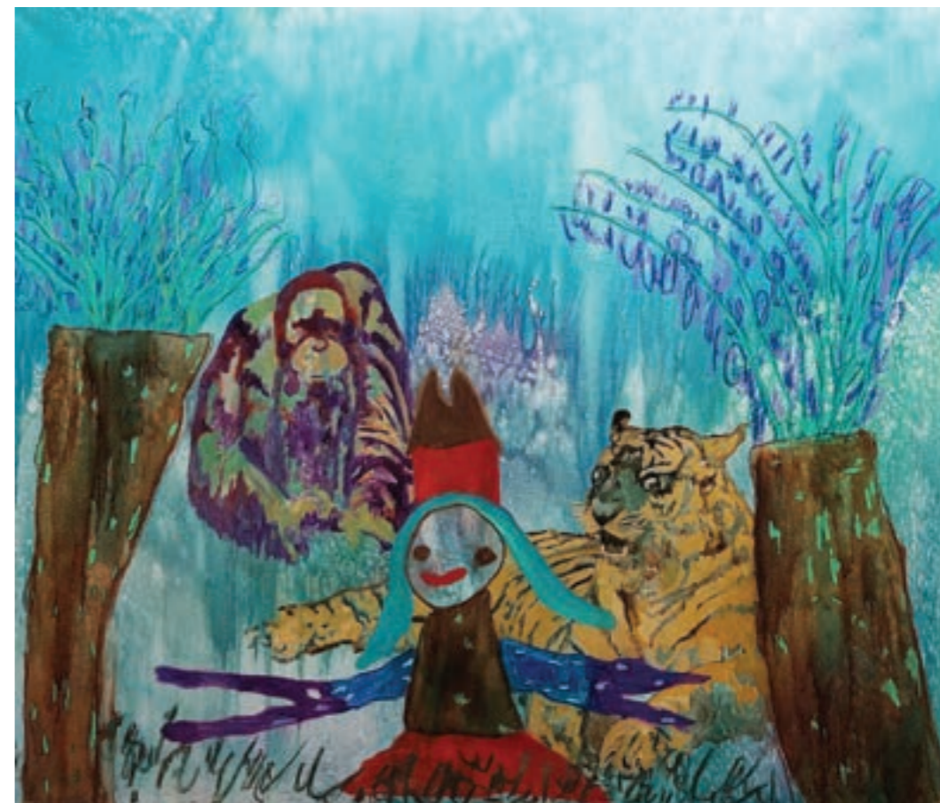
A mindenható 150 x 125 cm, vegyes technika