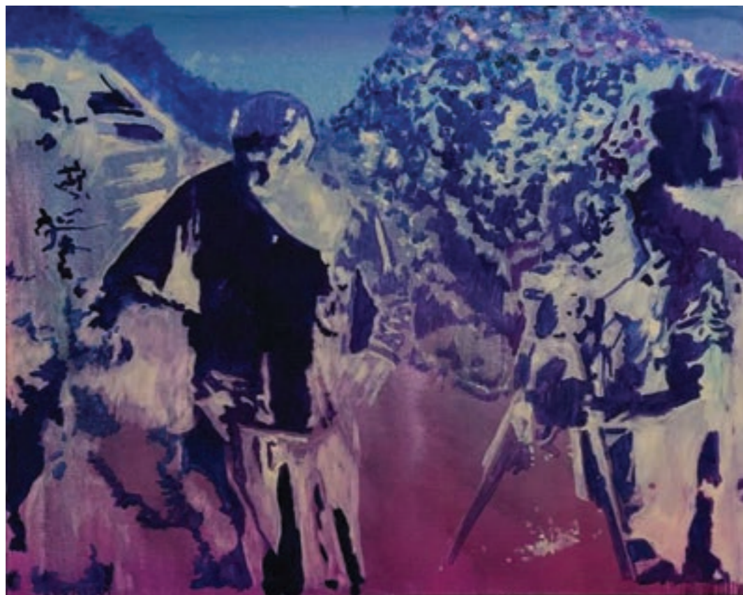
Reflektor fényben 100 x 80 cm, olaj, vászon