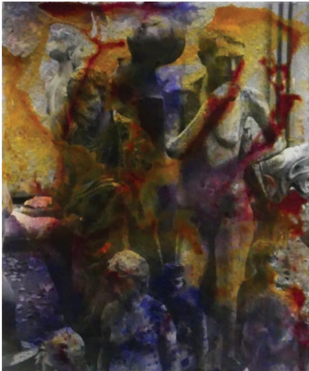
Etap II. 55 x 65 cm, vegyes technika