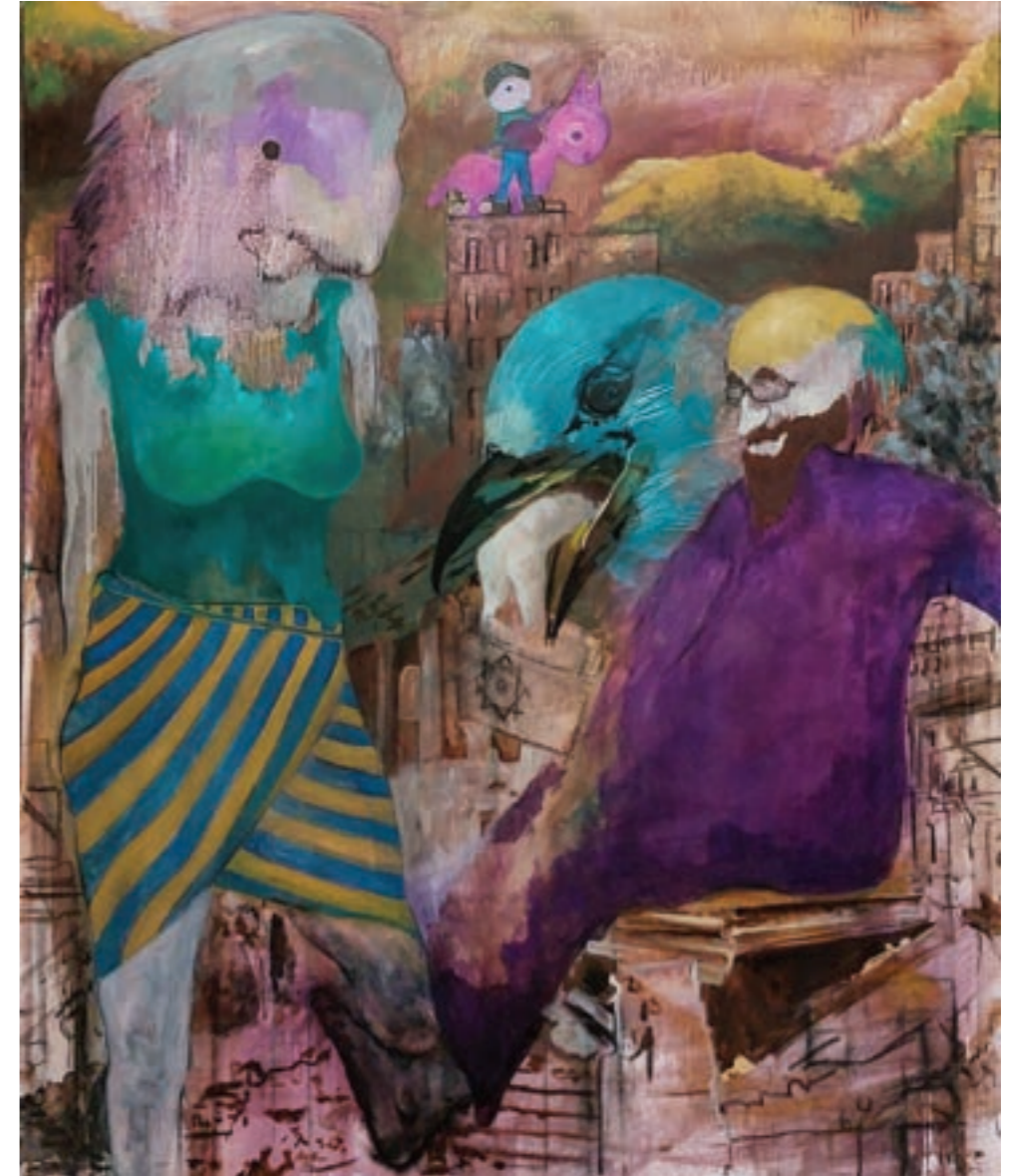
Emlékek párharca 125 x 150 cm, vegyes technika