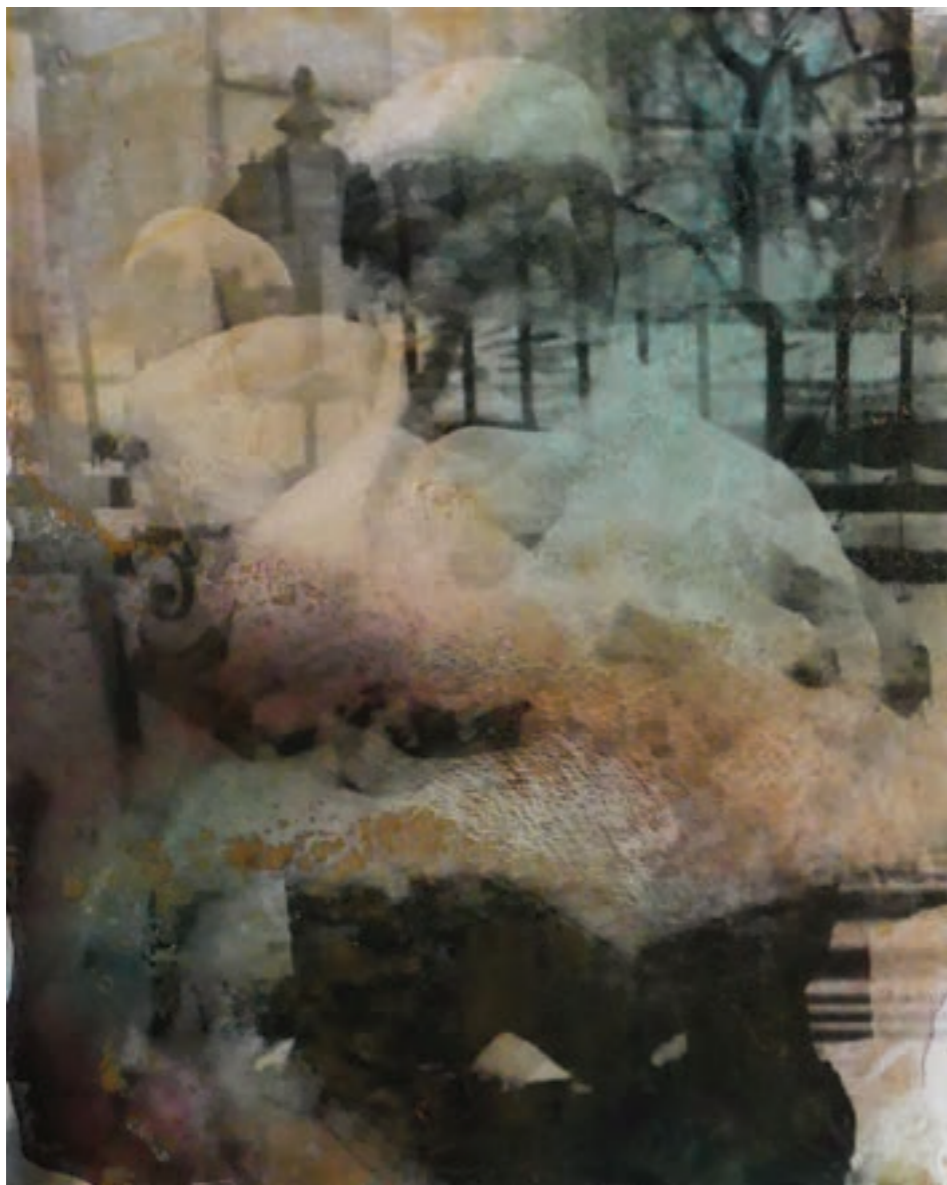
Percepció 50 x 60 cm, vegyes technika