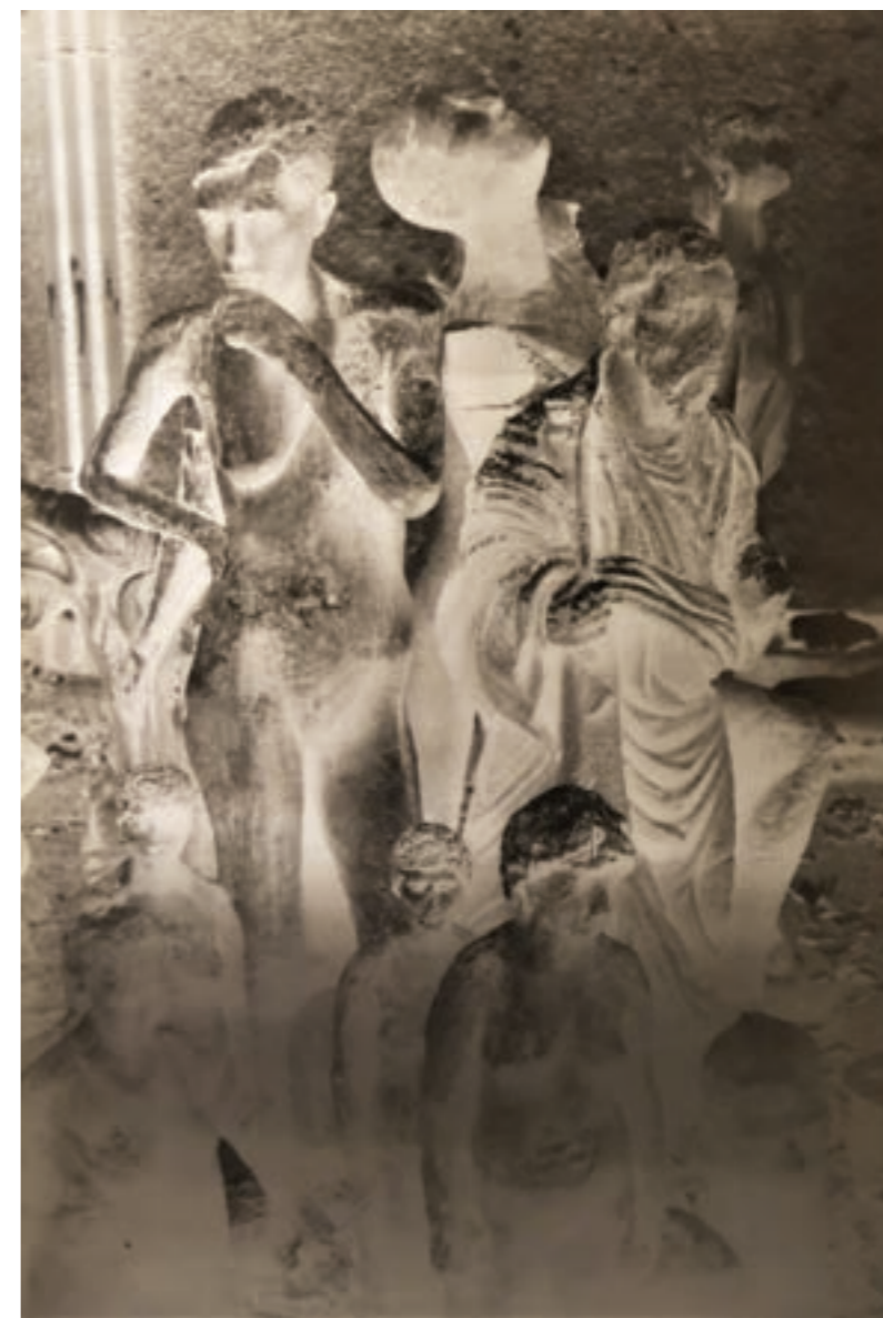
Otello 100 x 153 cm, kísérleti fotográfia