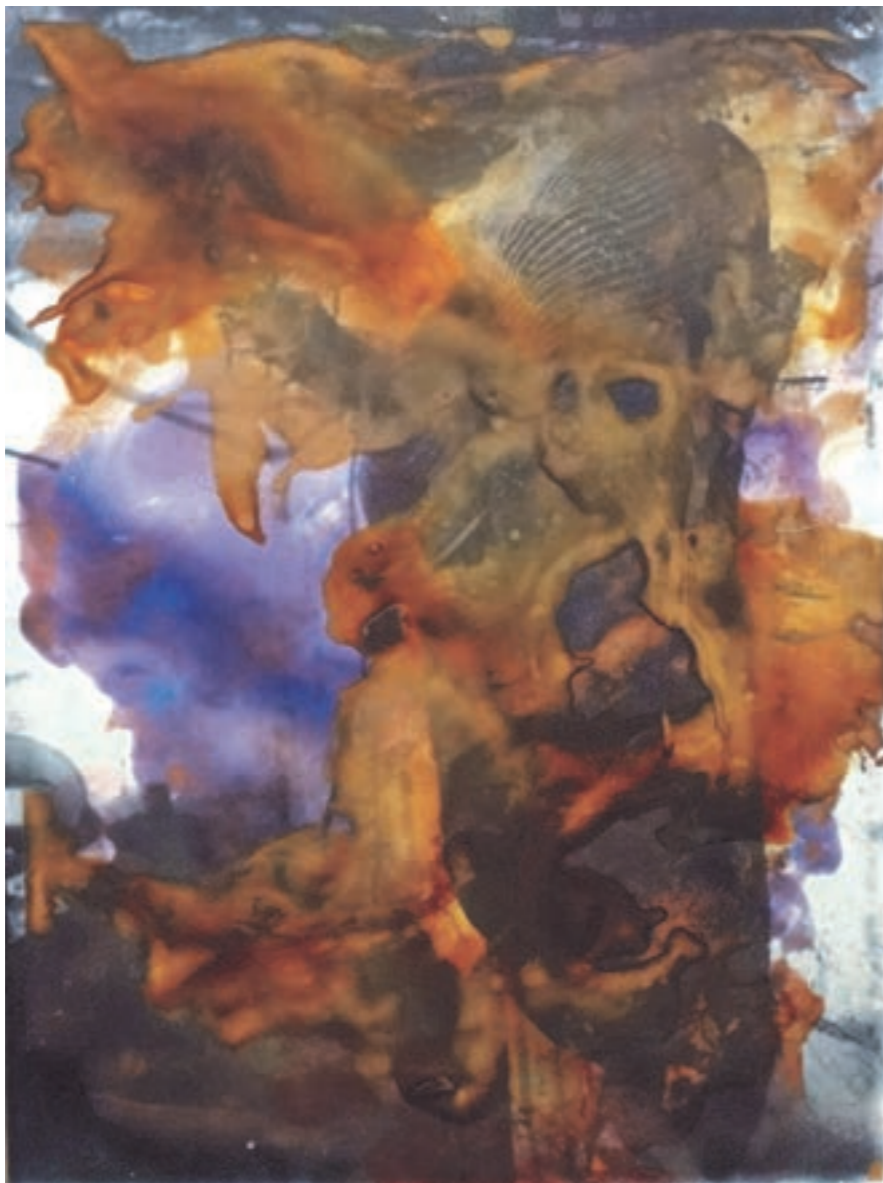
Prenatal 30 x 40 cm, vegyes technika