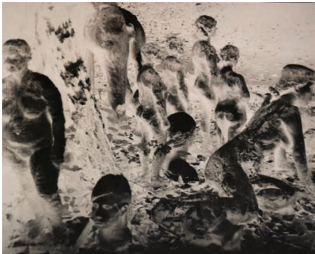
Erózió 78 x 58 cm, kísérleti fotográfia