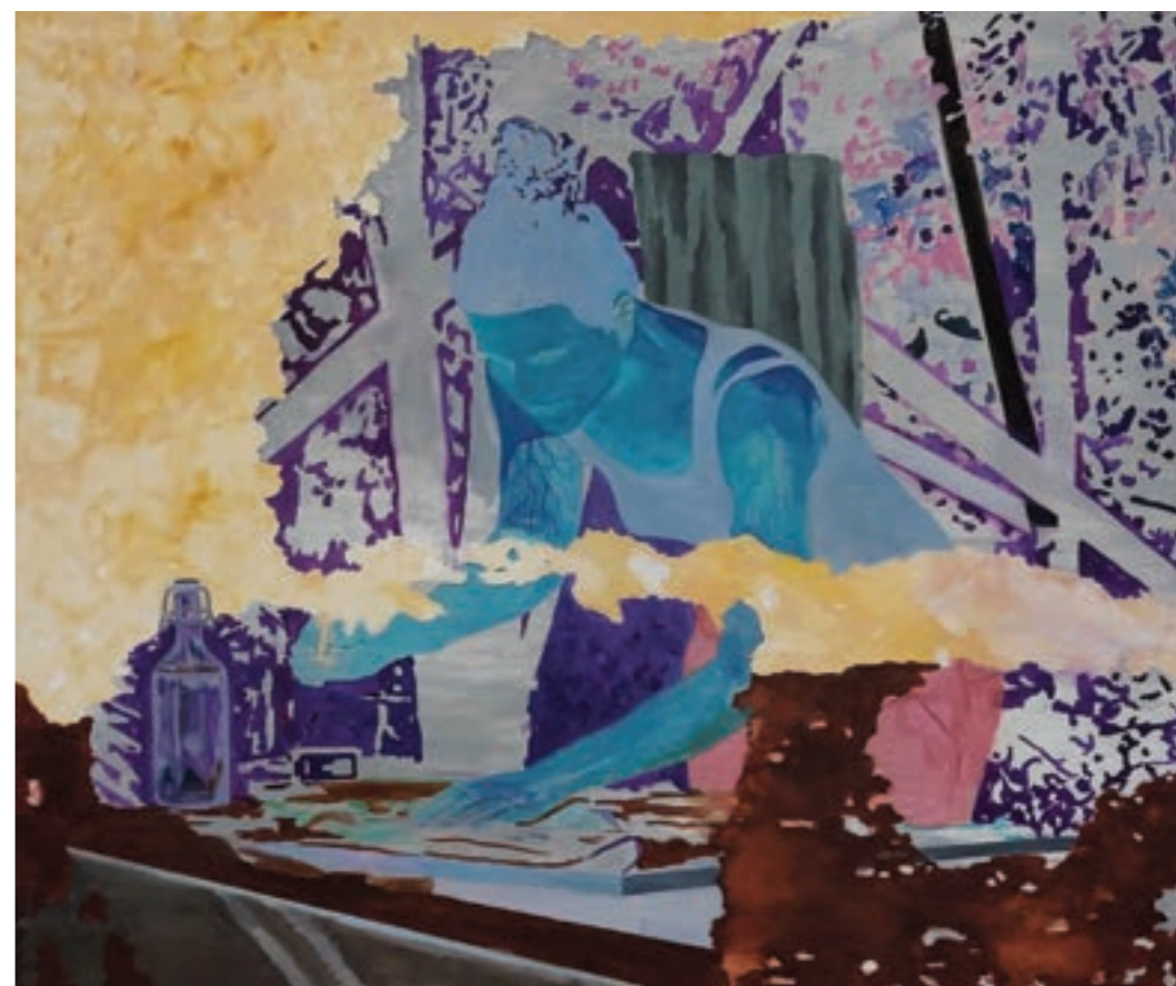
Rögzített pillanat II. 150 x 125 cm, olaj, vászon