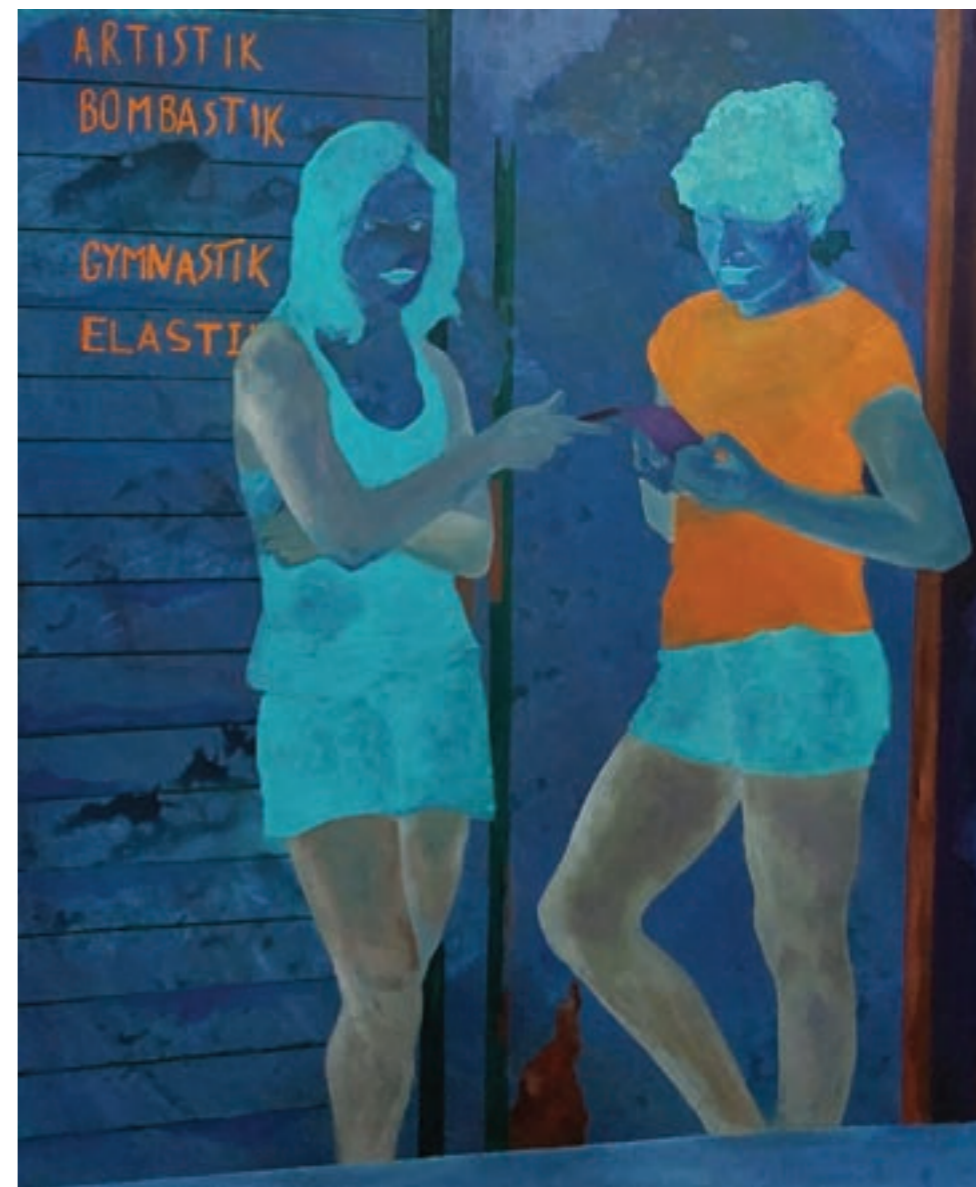
Üzenet a múltnak 100 x 120 cm, vegyes technika