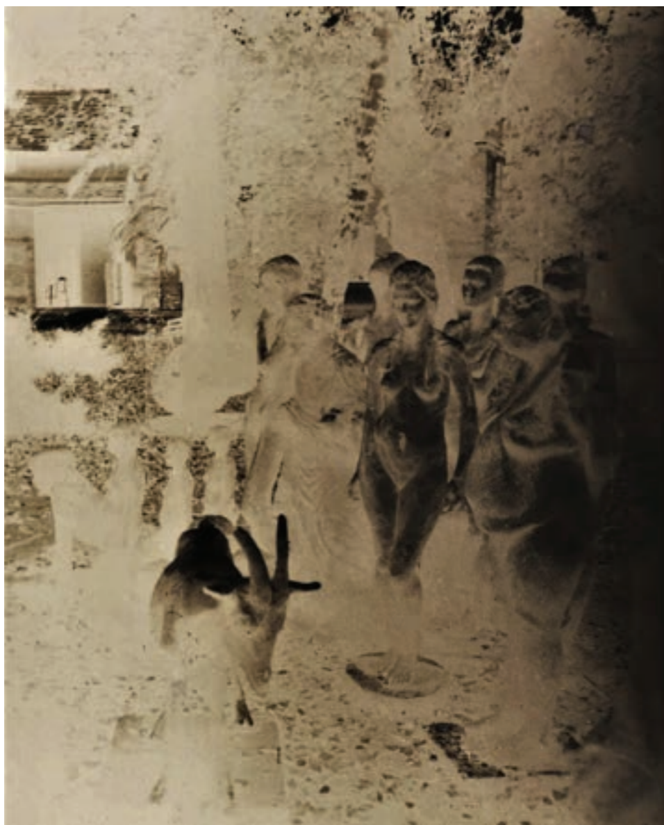
Bál 78 x 58 cm, kísérleti fotográfia