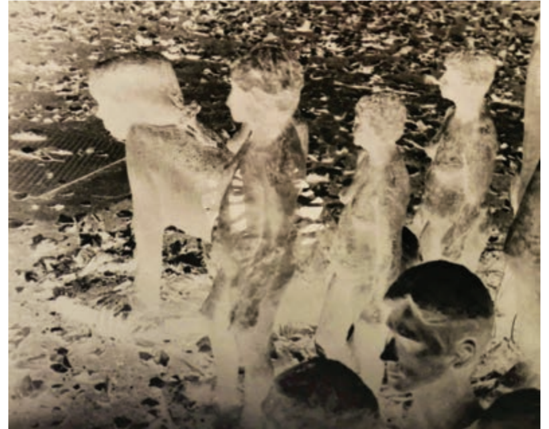
Összenőtt életek 60 x 50 cm, kísérleti fotográfia