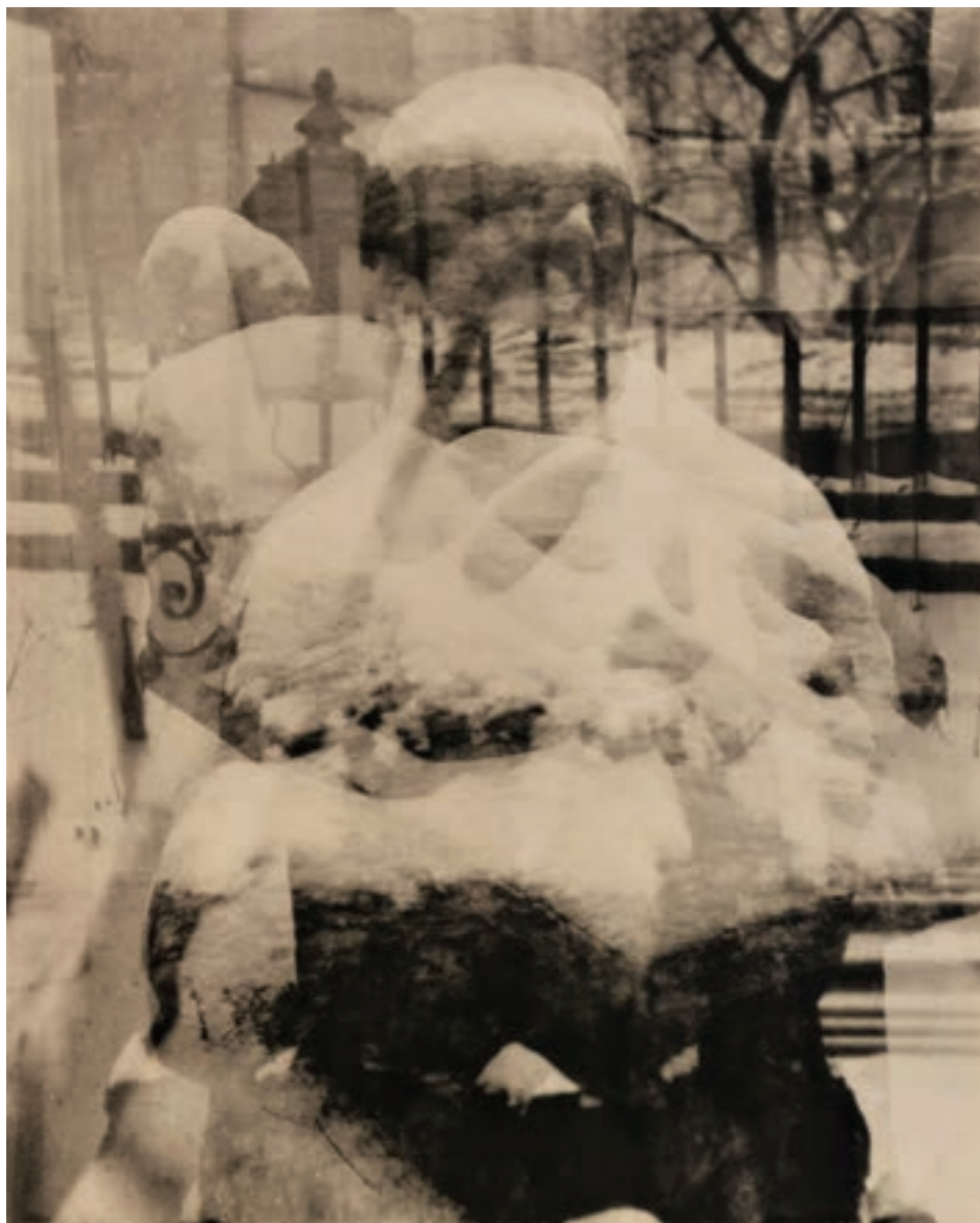
Összenót életek II. 58 x 78 cm, kísérleti fotográfia