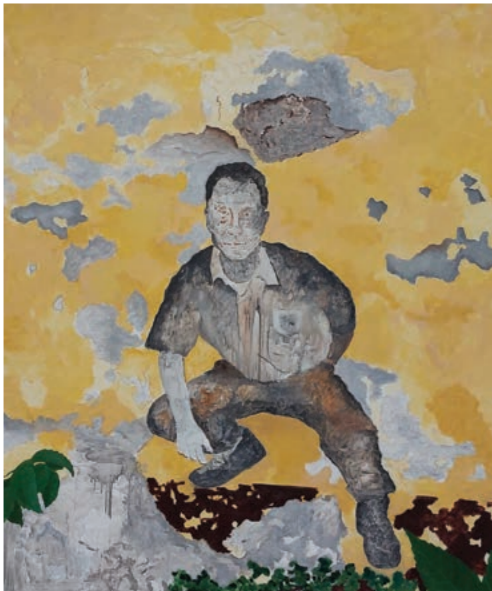
Rögzített pillanat III. 100 x 120 cm, olaj, vászon