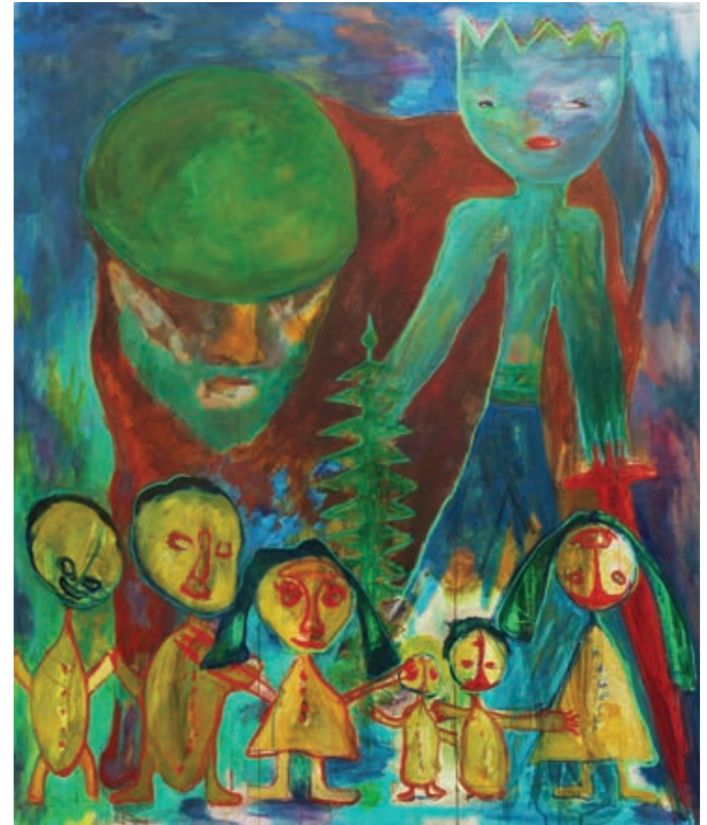
Aprónép 125 x 150 cm, vegyes technika