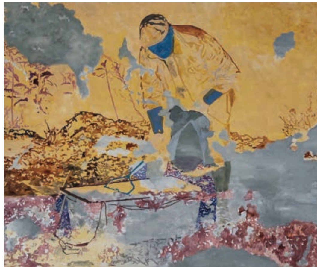
Rögzített pillanat 150 x 125 cm, olaj, vászon