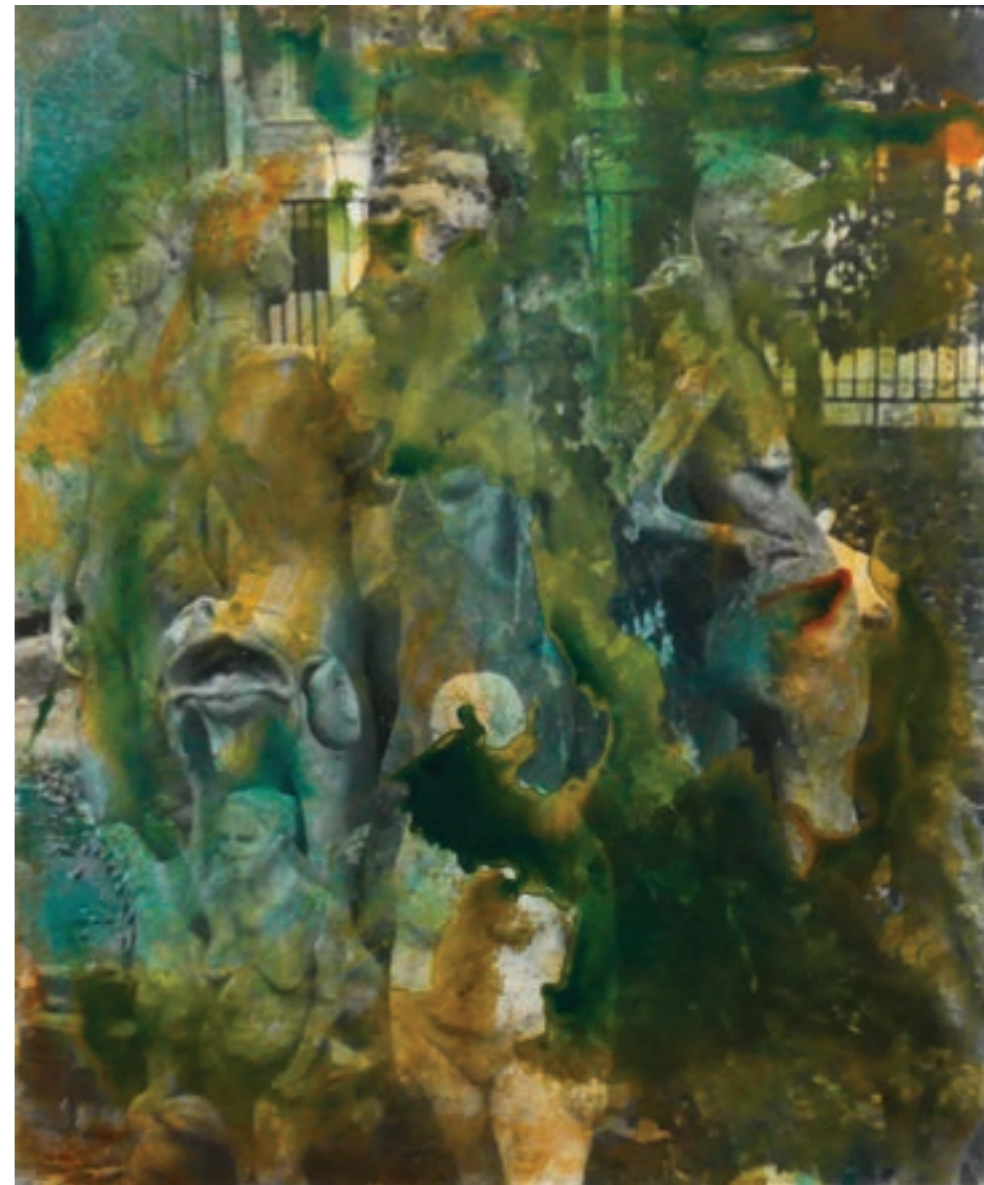
Etap 55 x 65 cm, vegyes technika