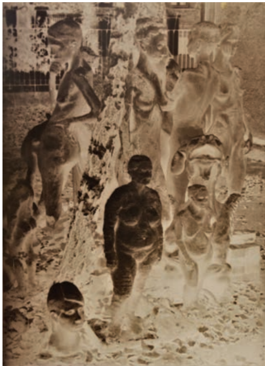
Úttalan utakon 100 x 153 cm, kísérleti fotográfia