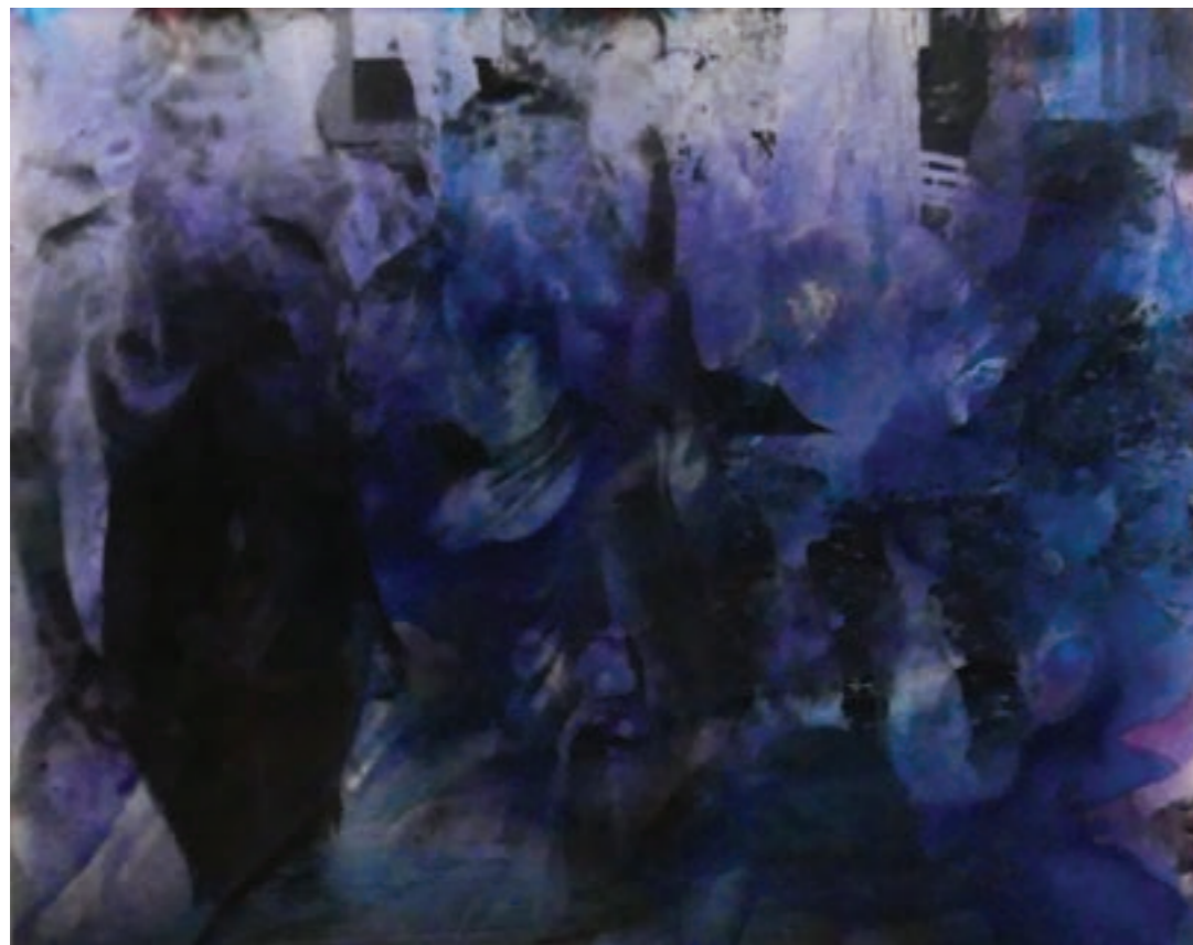
Metamorfózis 60 x 50 cm, vegyes technika