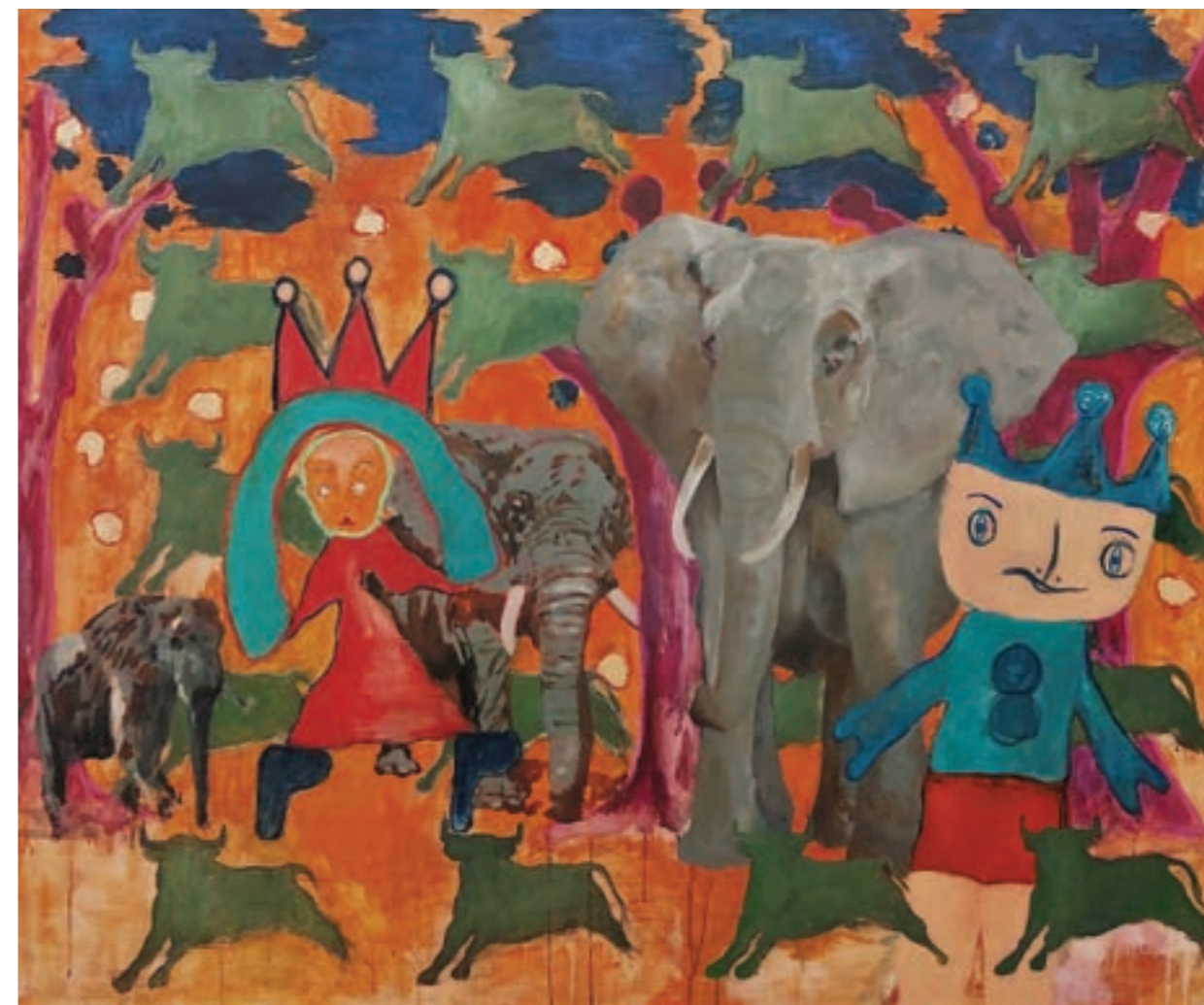
Látomás 150 x 125 cm, vegyes technika