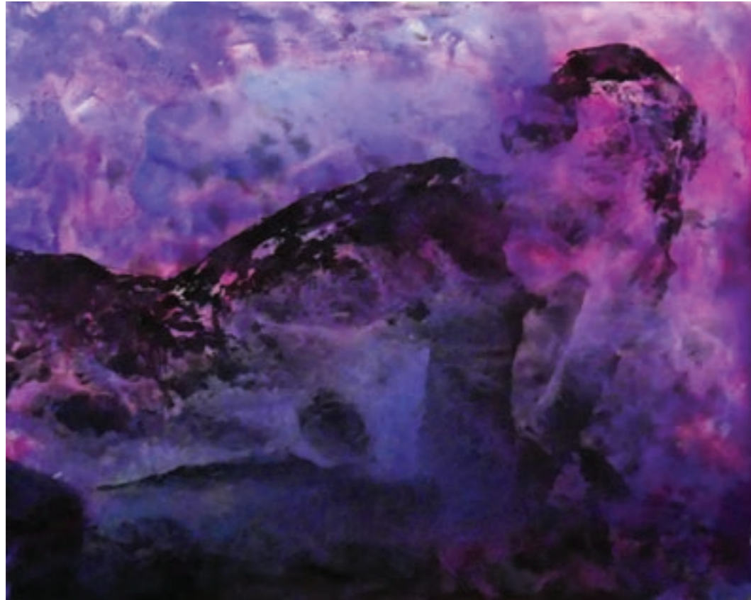
Ophelia 60 x 50 cm, vegyes technika