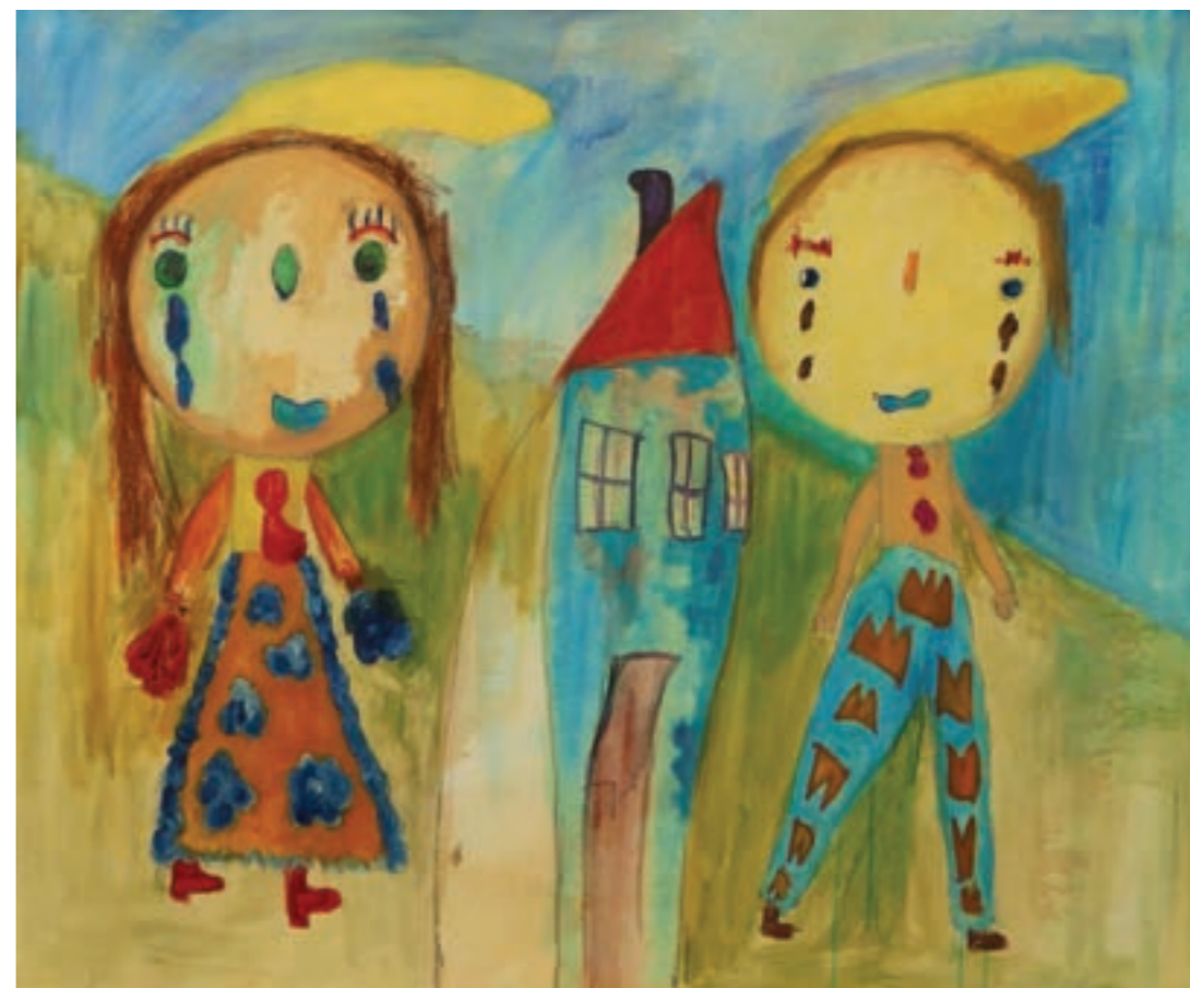
Kalandorok 120 x 100 cm, vegyes technika