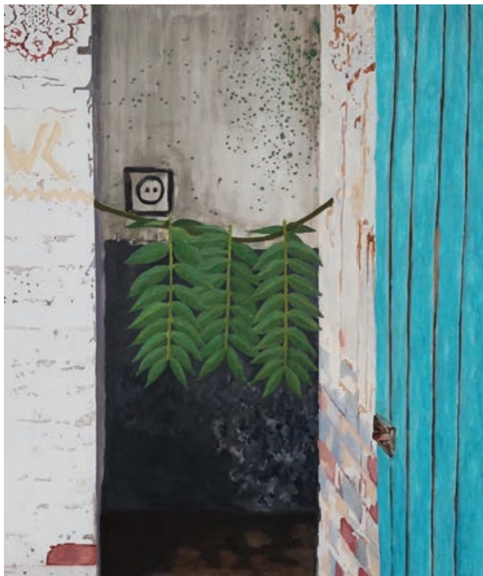
Vidéki hangulat 100 x 120 cm, olaj, vászon