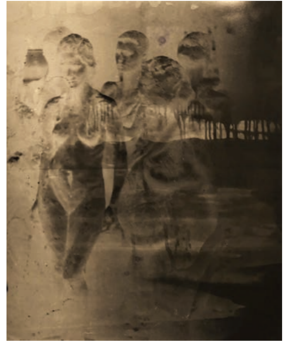
Megsemmisült mozdulatok 57 x 48 cm, kísérleti fotográfia