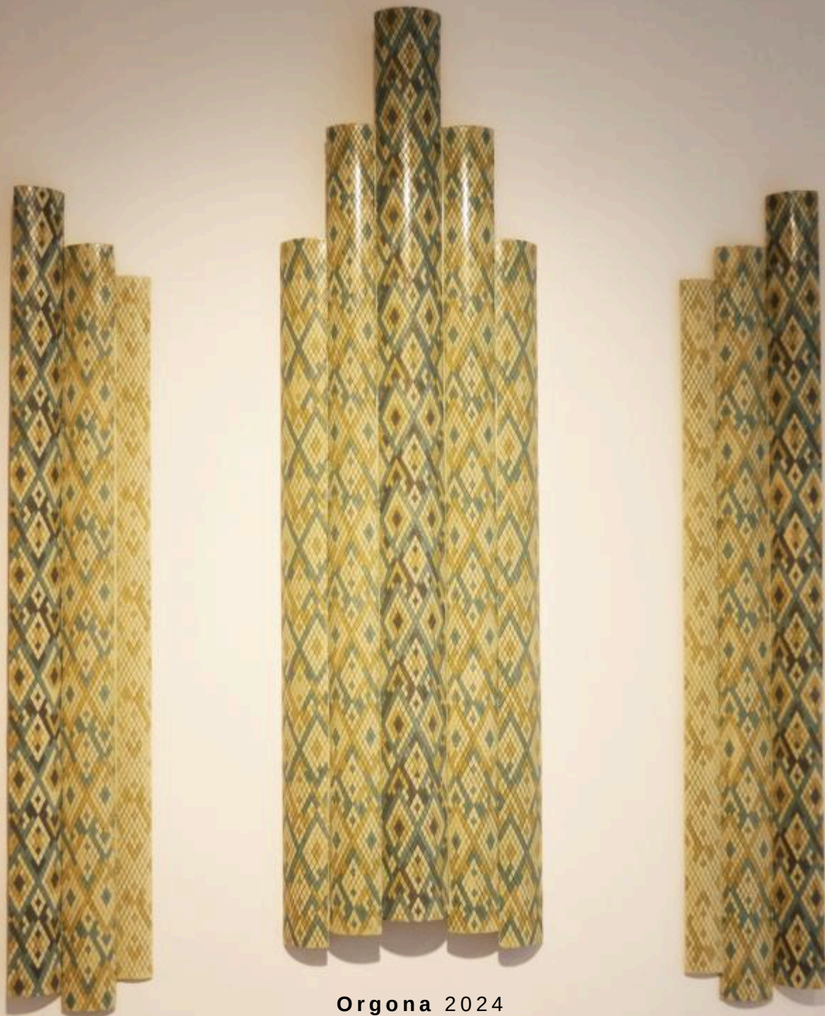
Orgona 2024 színezett akril gyanta változó méret