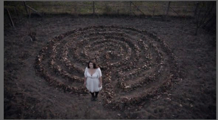
Labirintus II., performansz-vidéó, részlet, Albertirsa, 2025