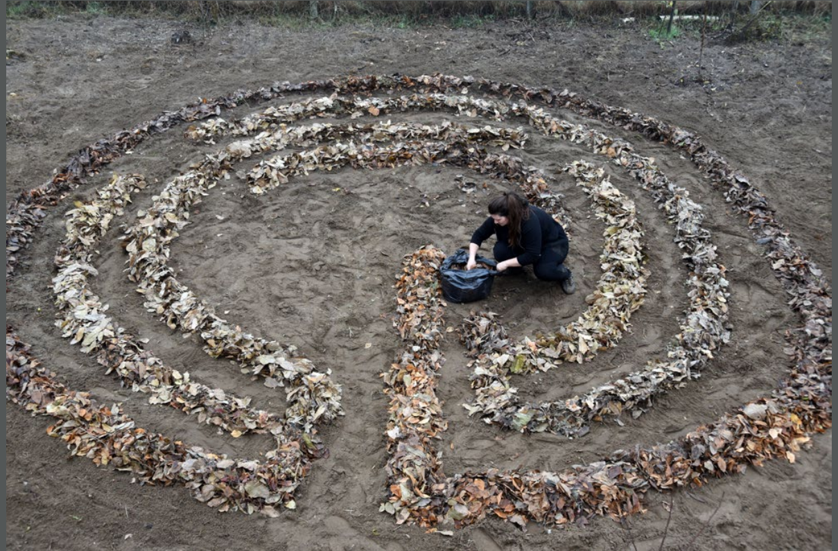
Labirintus építése, Albertirsa, 2025

A labirintus egyszerre hordozza magában a téboly és a meditáció lehetőségét, a szorongást és a reménységet. Az általam falevelekből épített labirintusok egy önvizsgálati térré váltak számomra. A projekt részeként végigjártam a labirintust. A séta egyfajta performanszként működött - lassú, meditatív mozgásként, amelyben az eltévedés és a visszatalálás is szerepet kapott. A labirintusban való séta egyszerre volt megnyugtató és felkavaró.