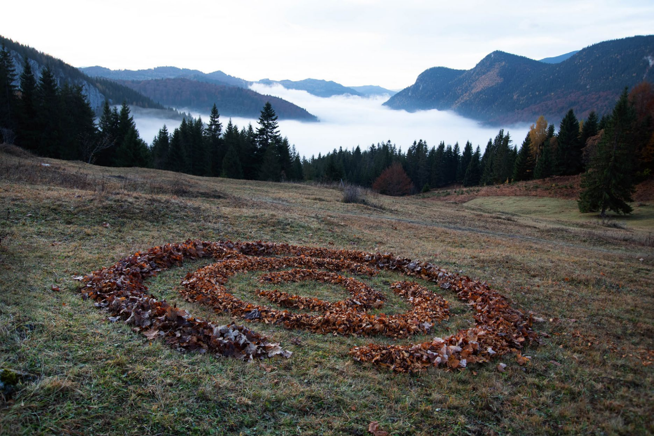
Labirintus I., Land Art, Erdély, 2025