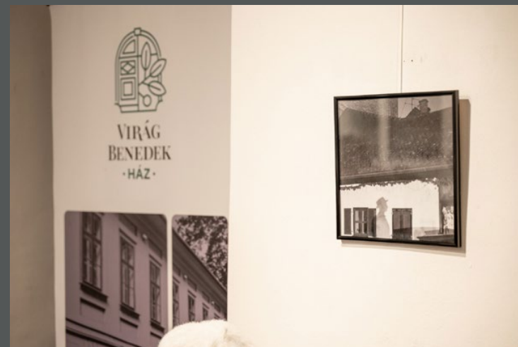
Márai Budán, Budapest, Virág Benedek Ház, 2025