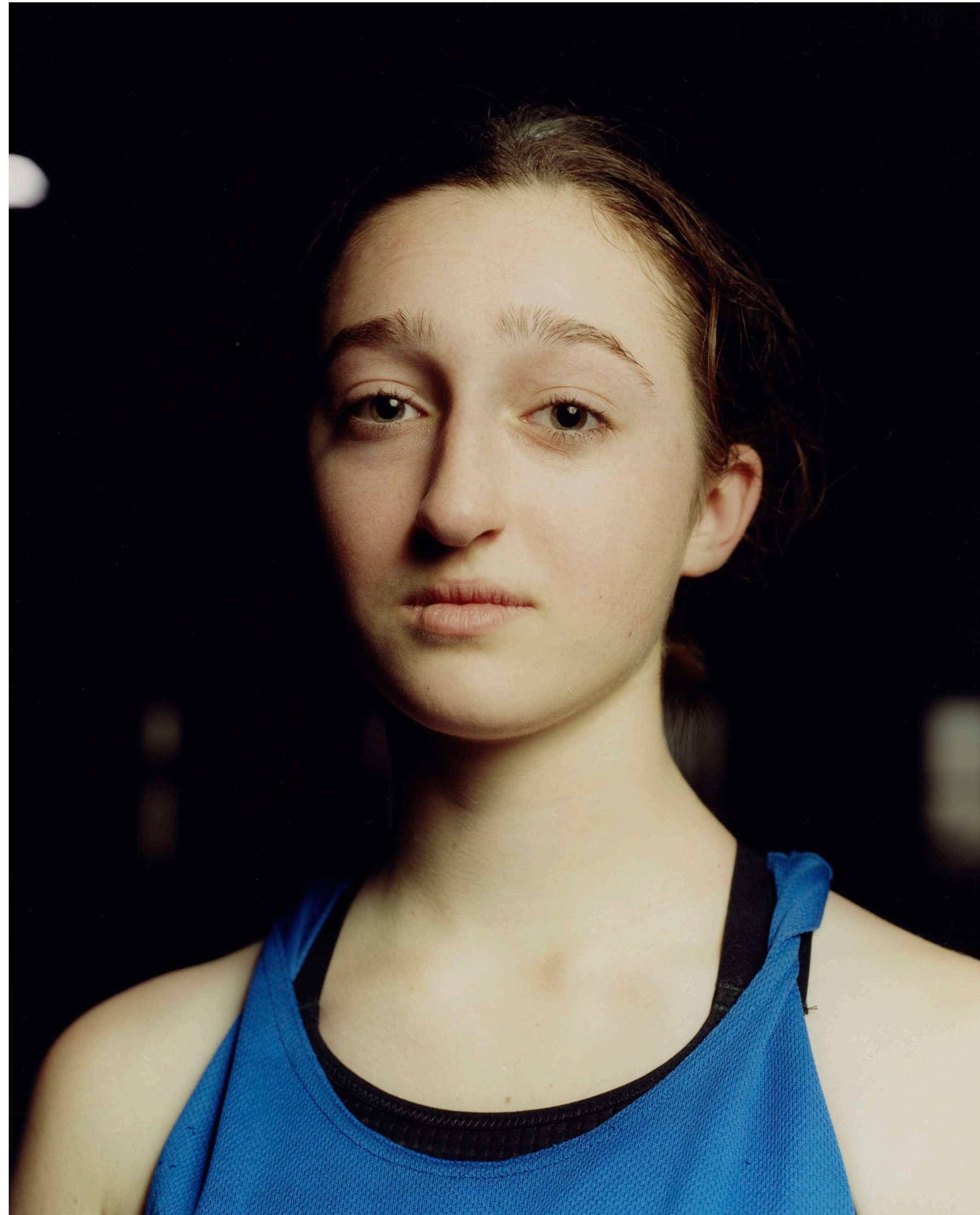
Ökölvívó Lány Ózd 2021 C-print