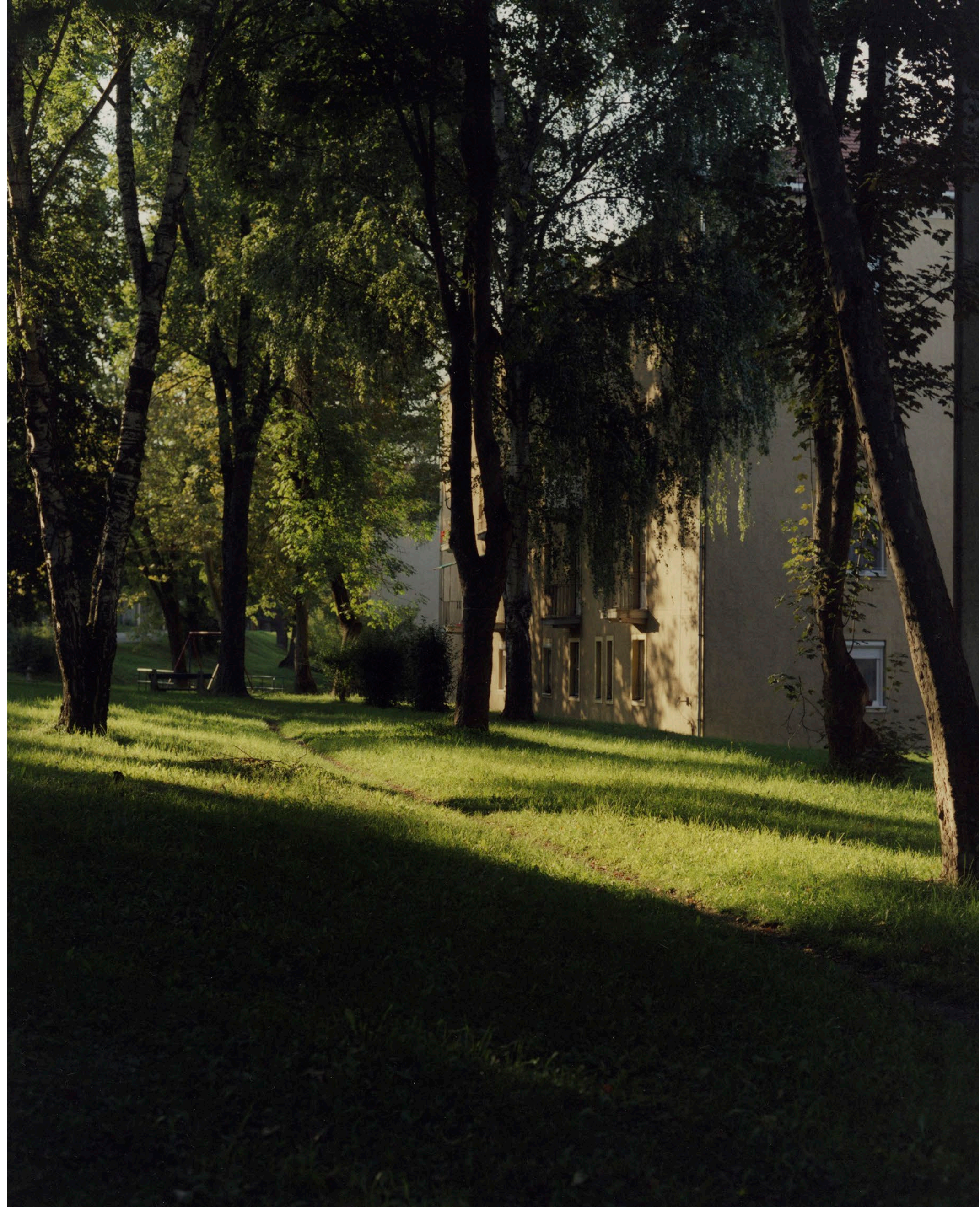
Telep Ózd 2022 C-print