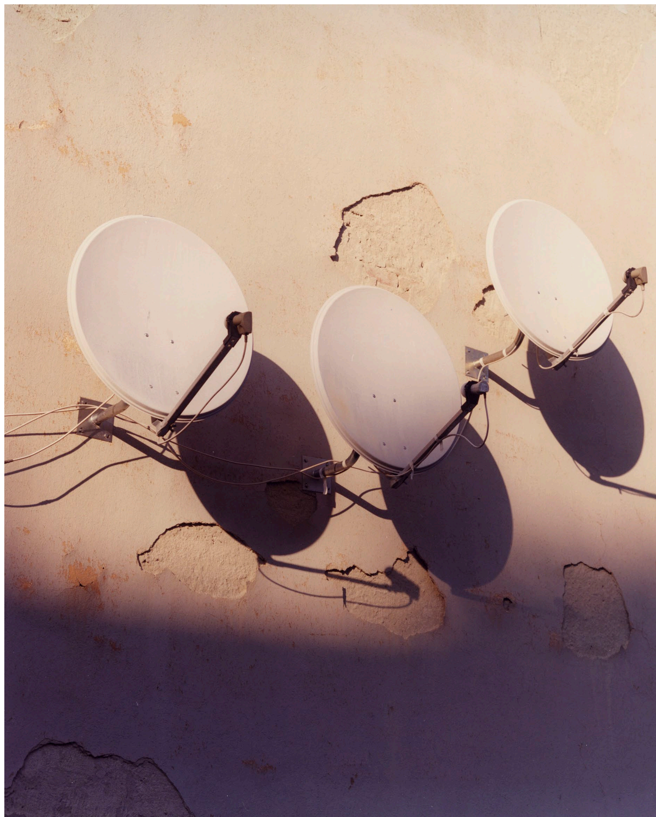
Naplemente Ózd 2021 C-print