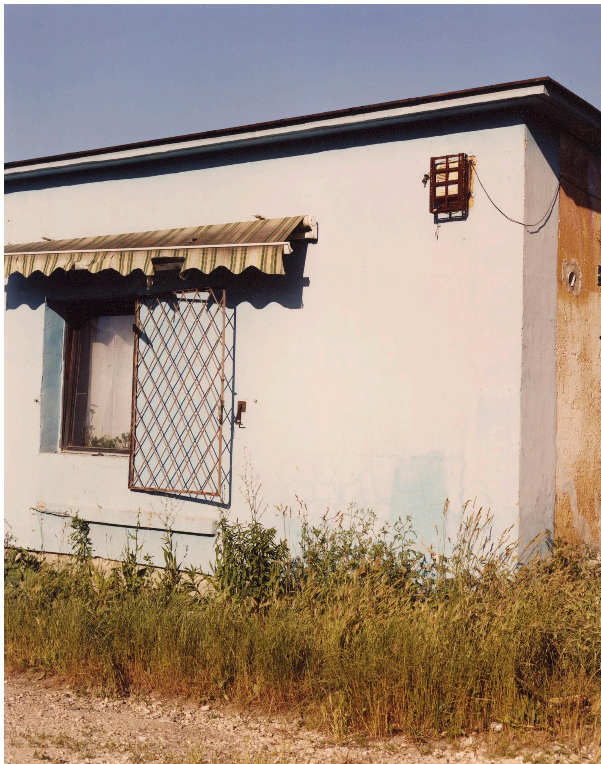
Meszes Tatabánya 2021 C-print