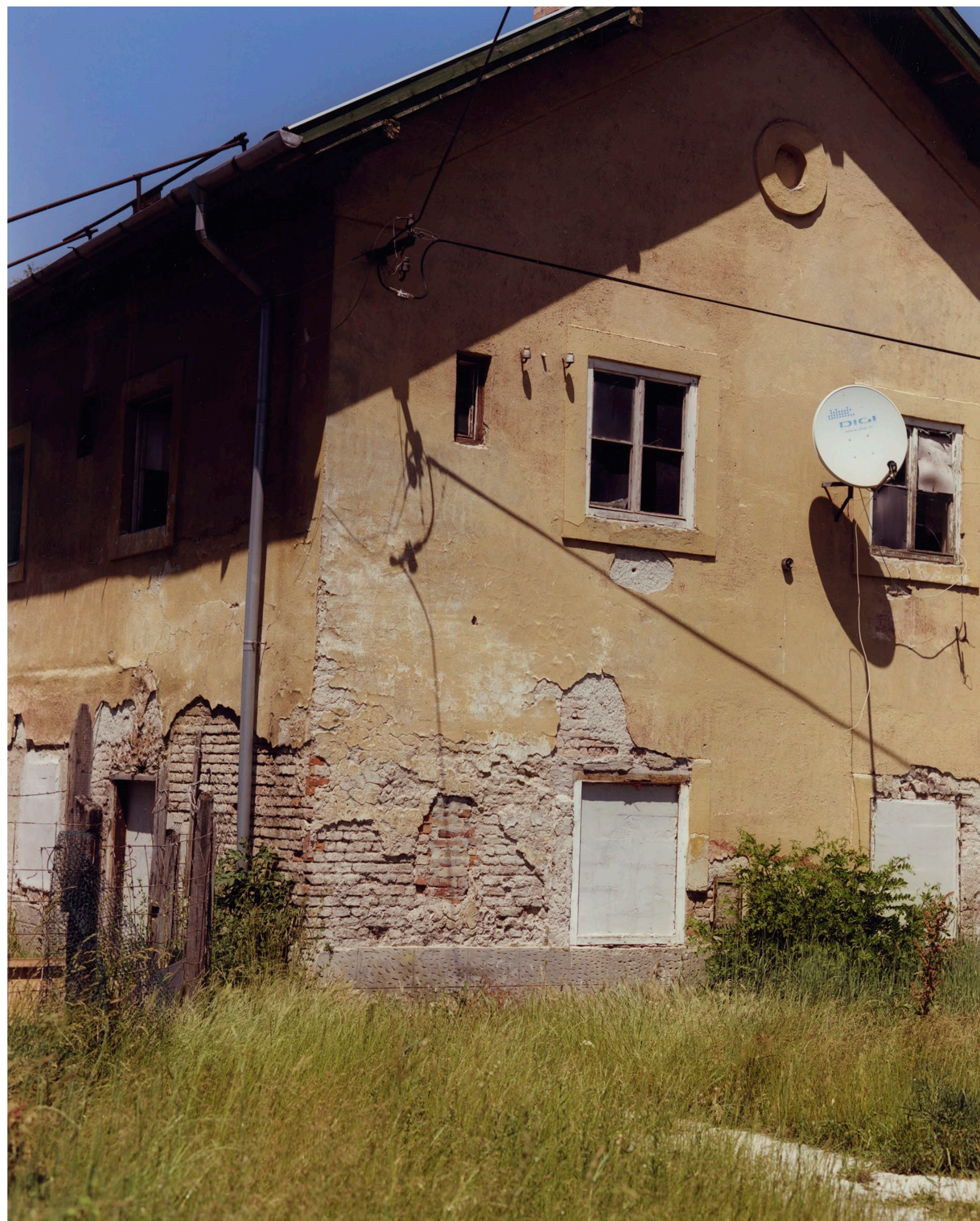
Ház Tatabánya 2021 C-print