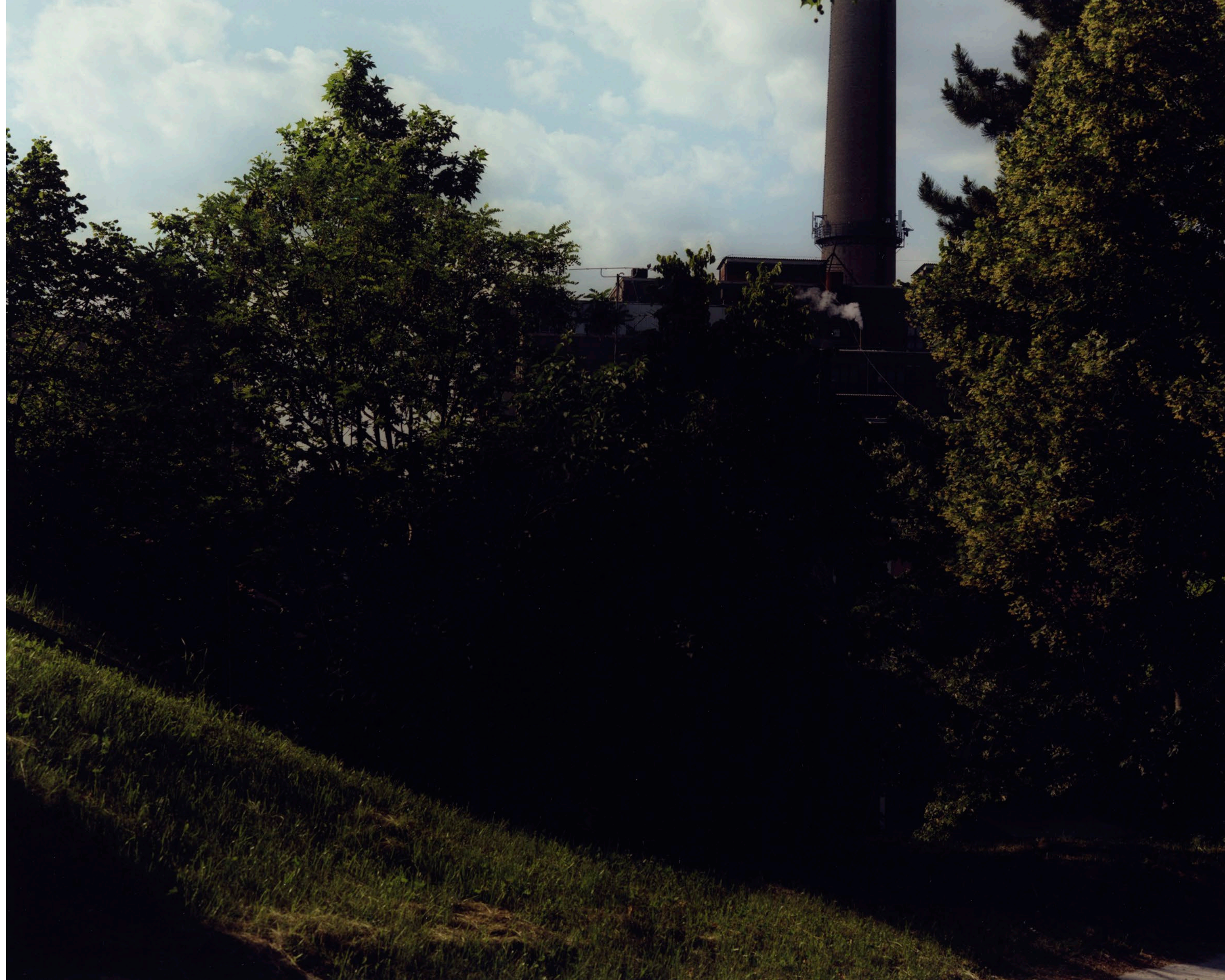
Erőmű Ajka 2021 C-print