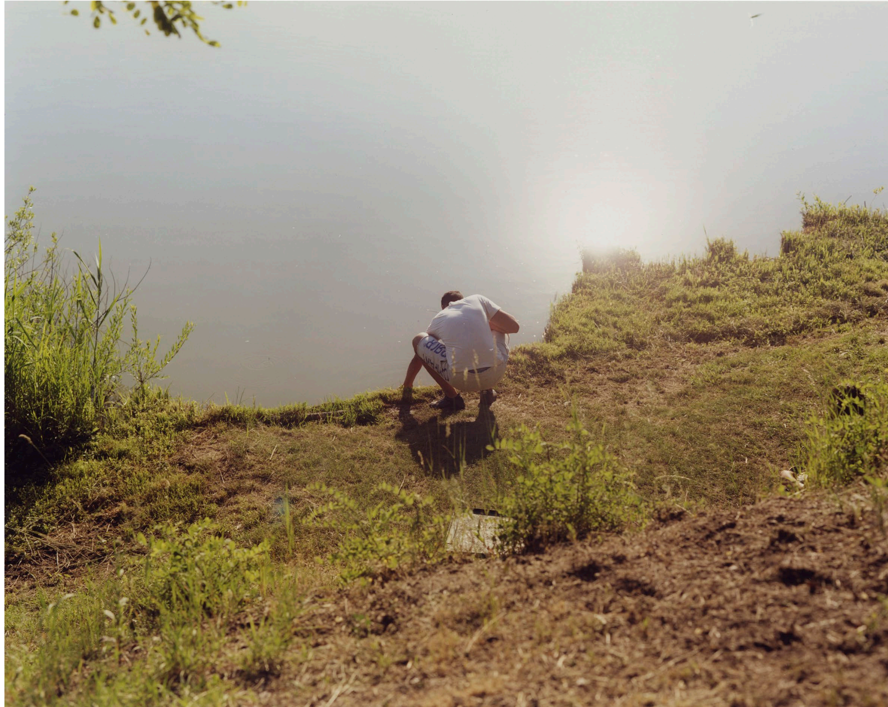
Vizet mérő férfi Tatabánya 2021 C-print