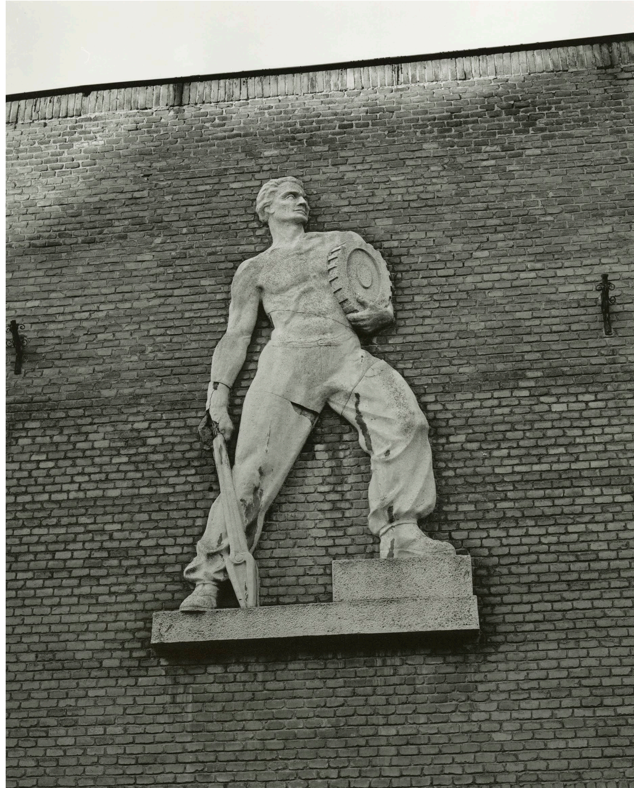
Relief Ózd 2021 C-print