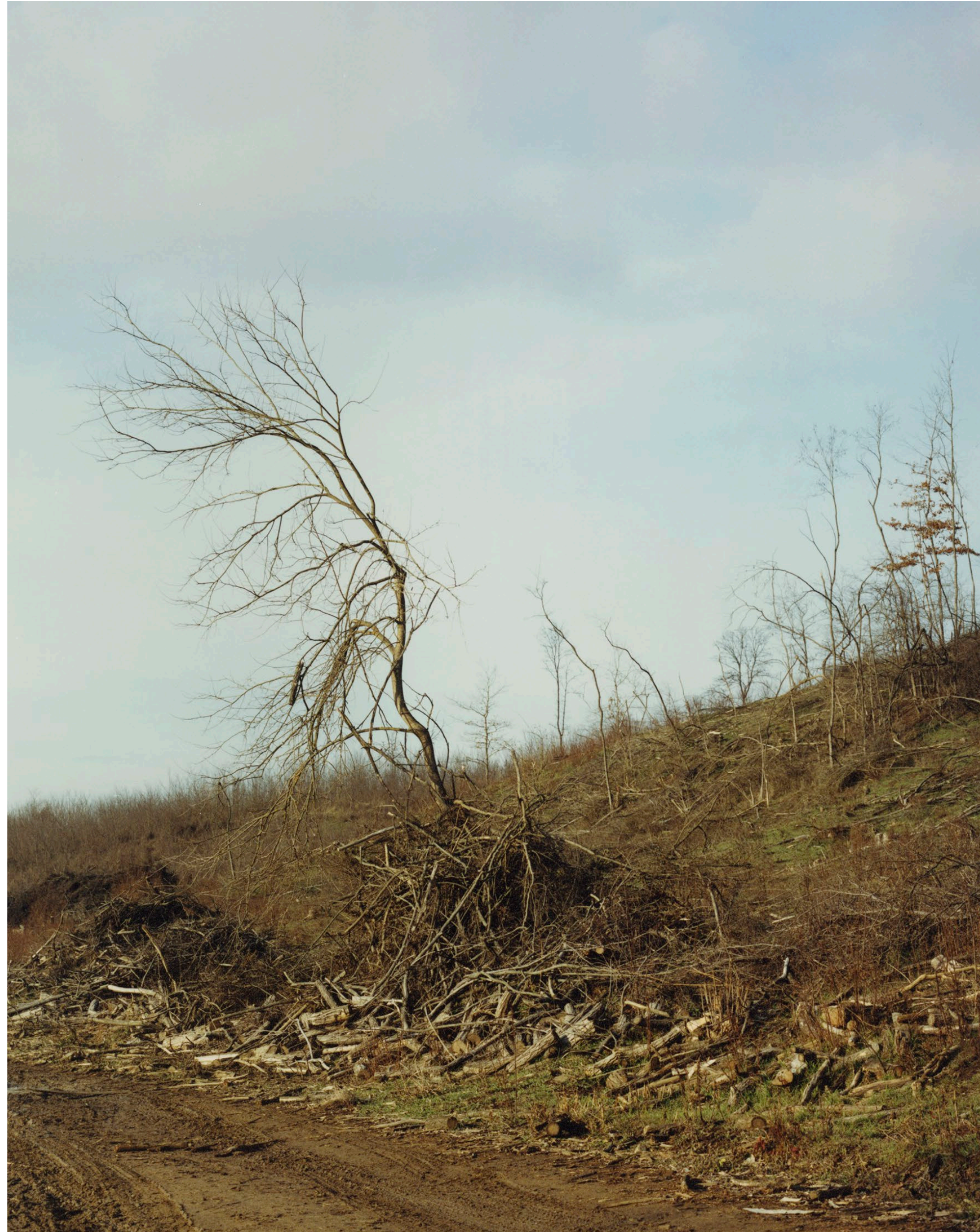
Erdő Ózd 2022 C-print