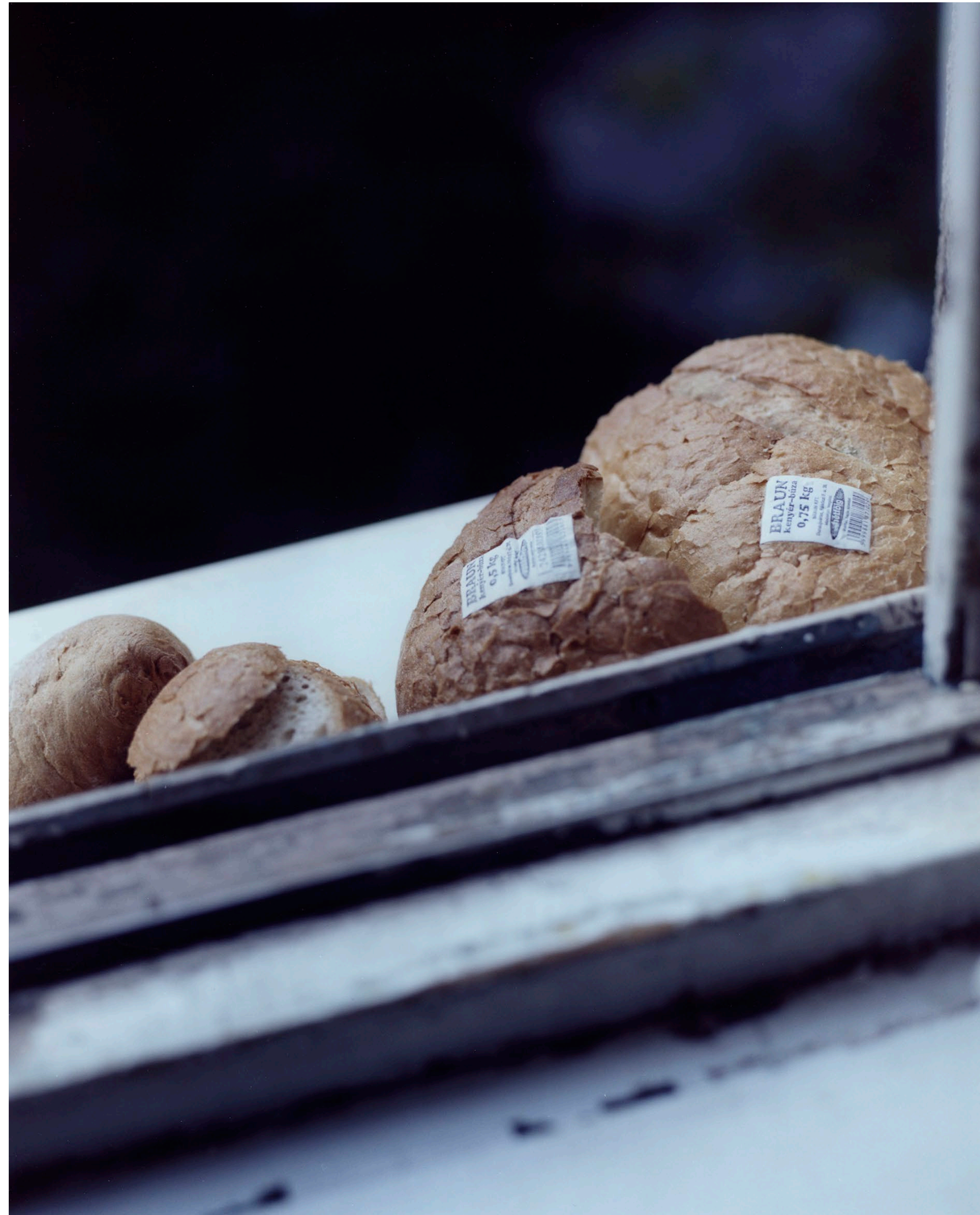
Kenyerek Dunaújváros 2021 C-print