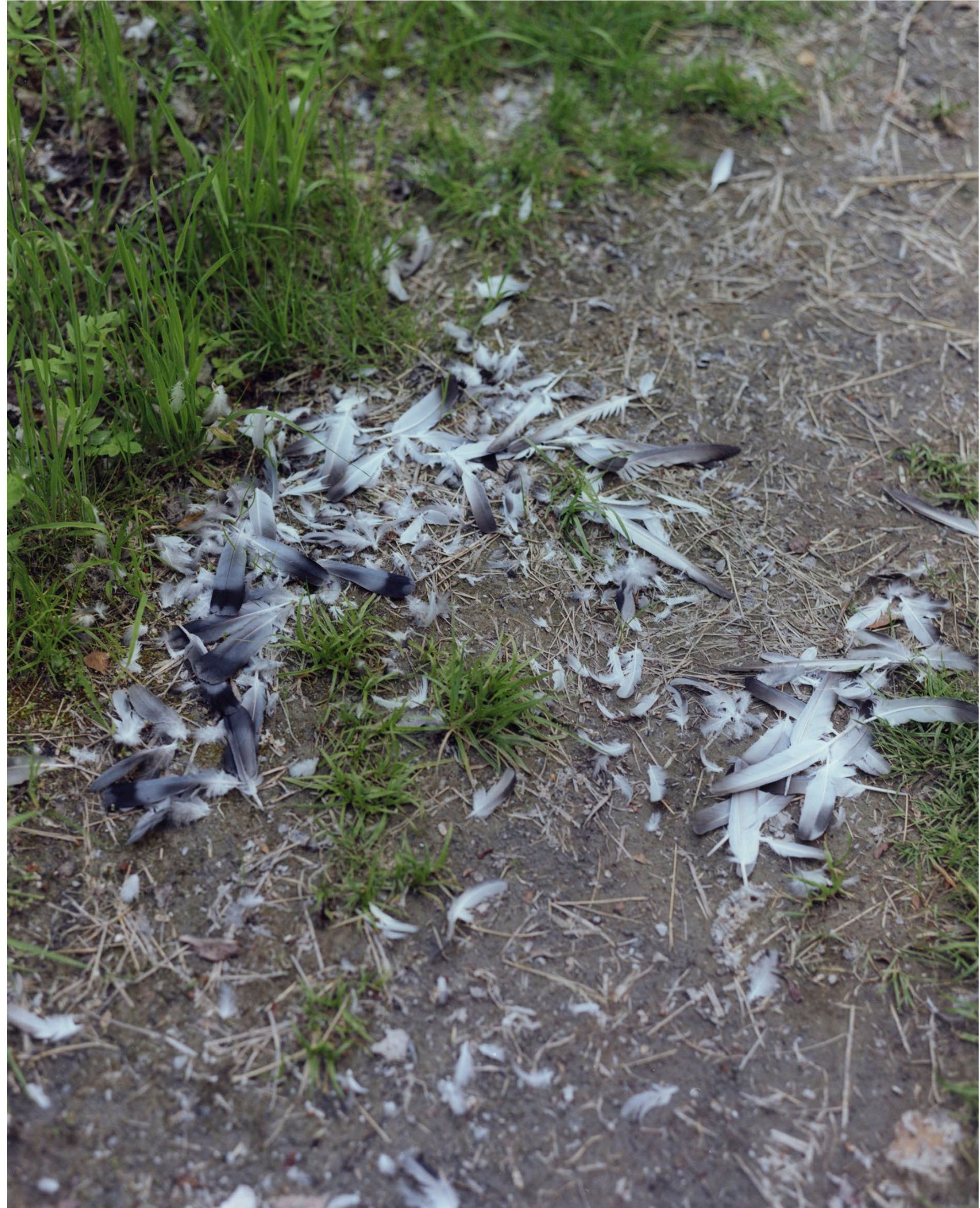
Tollak Ajka 2021 C-print