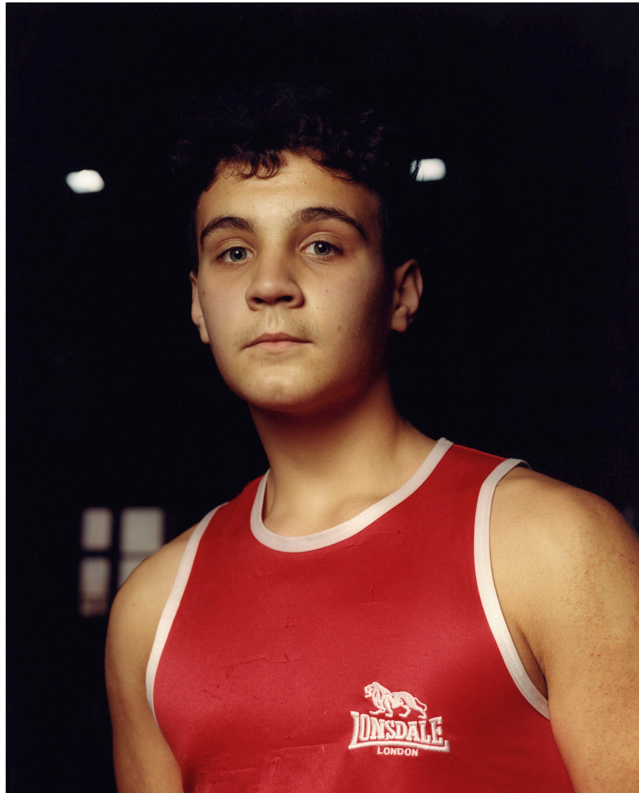
Ökölvívó Fiú Ózd 2021 C-print