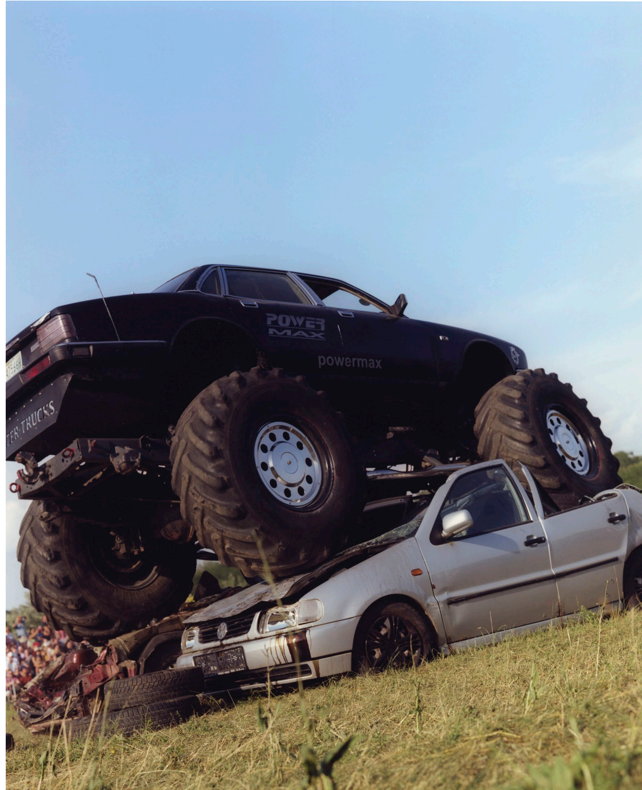
Monster Truck Tatabánya 2021 C-print