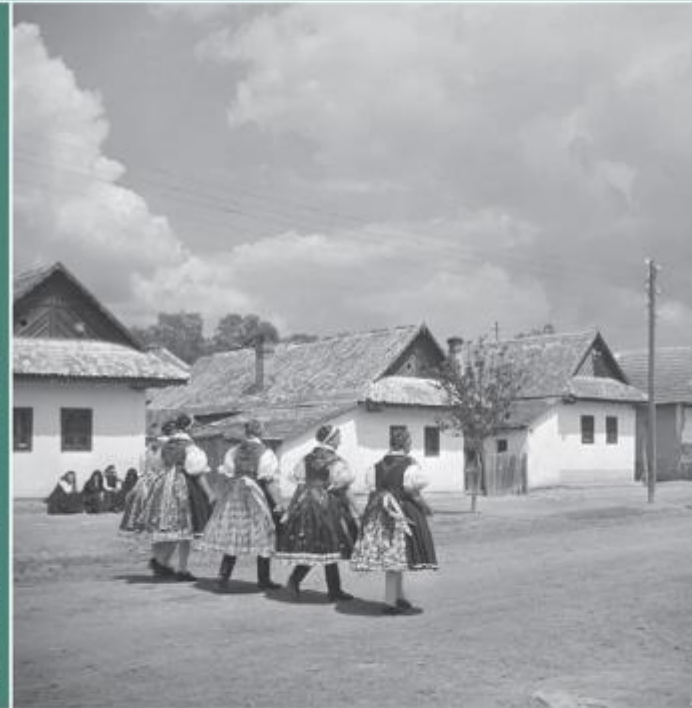
MUSICOLOGIA HUNGARICA 10

NÉPZENEKUTATÁS MAGYARORSZÁGON A KÉT VILÁGHÁBORÚ KÖZÖTT